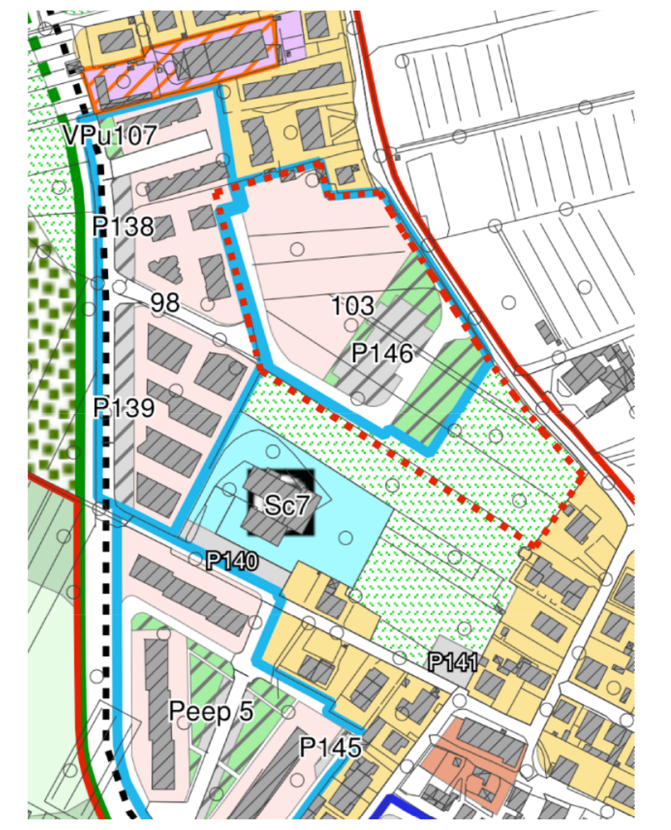
ESTRATTO DI R.U. scala 1:2000