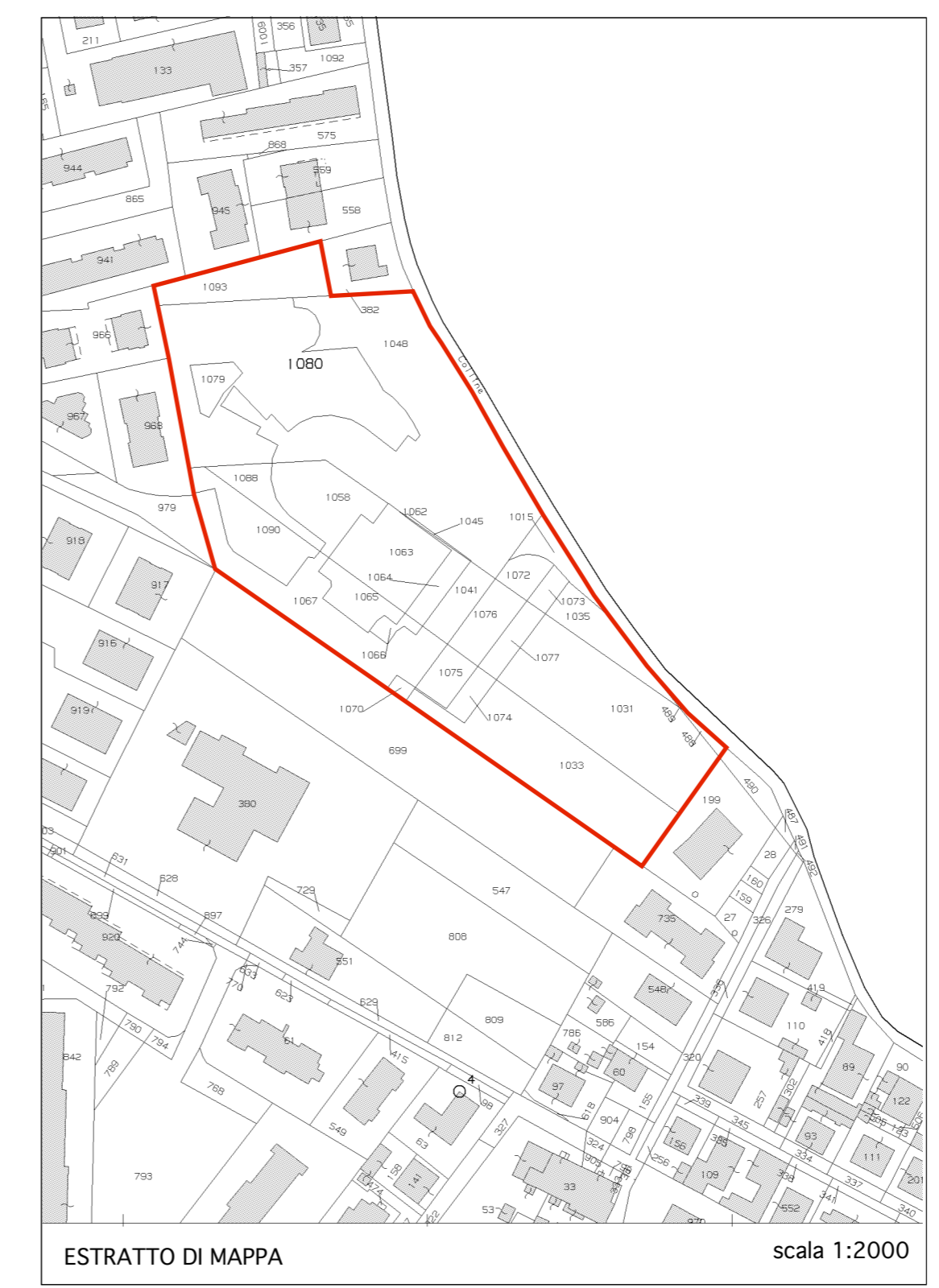
Superficie Territoriale = mq. 17514