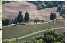
Peccioli le Serre