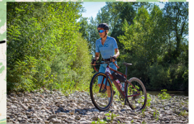
Guado Era gravel