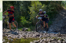
Guado fiume Era