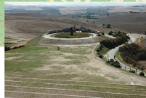
Teatro del Silenzio