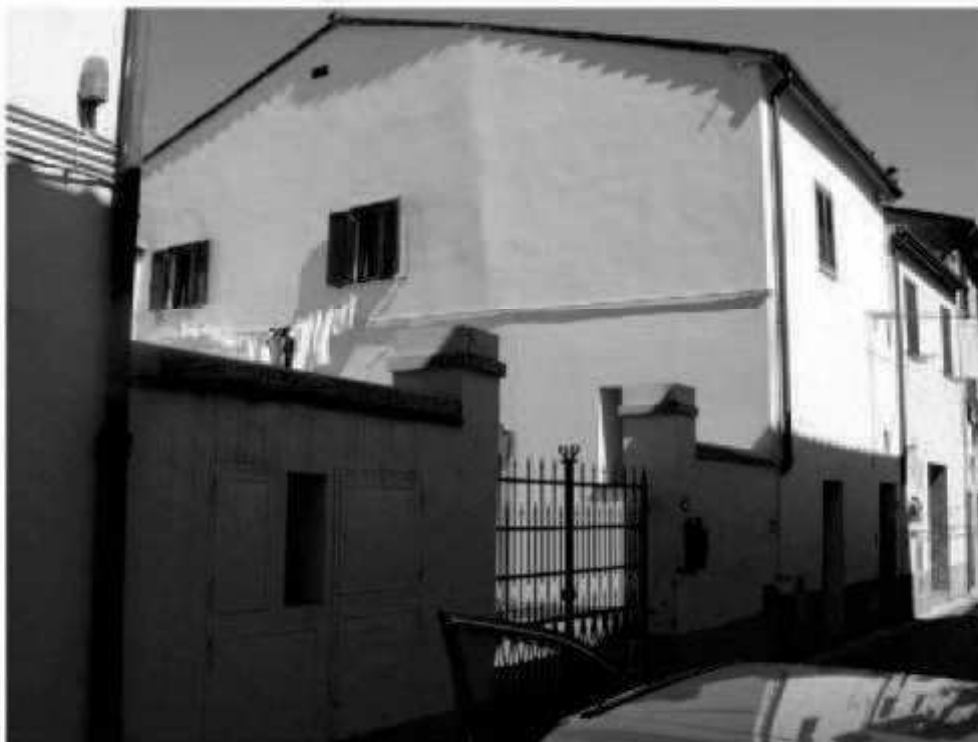
L 7a via Magenta