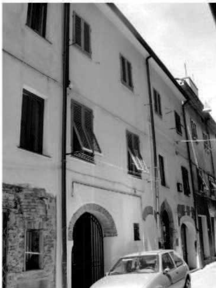
O 5 via Garibaldi