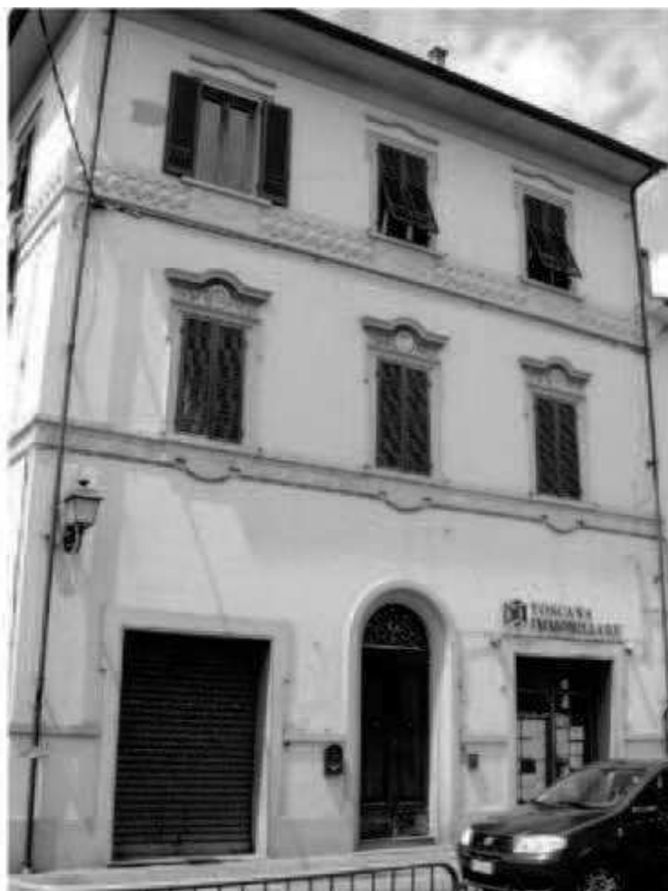
V 1 (piazza Repubblica) via Roma