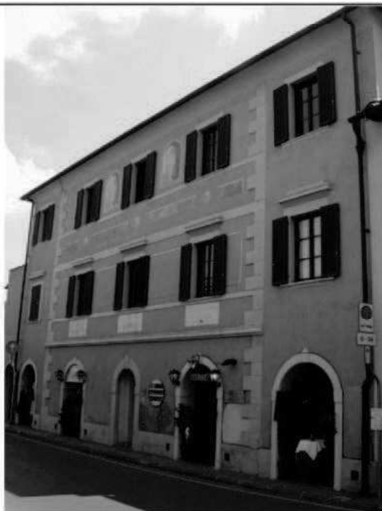
R 2 - via Melegnano