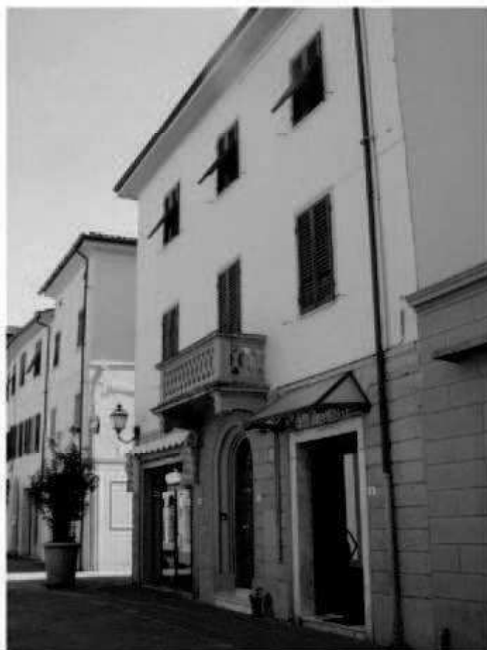
P 2 corso Matteotti