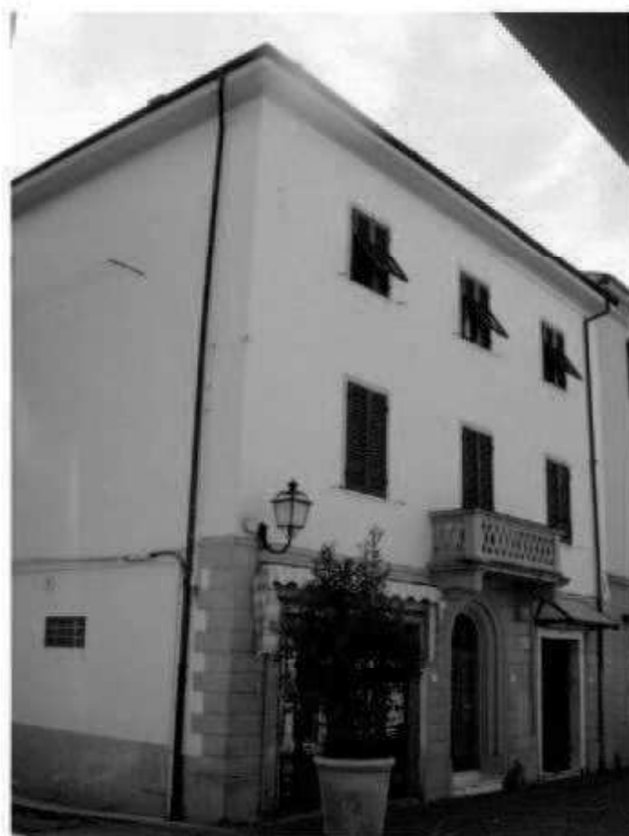
P 2 corso Matteotti