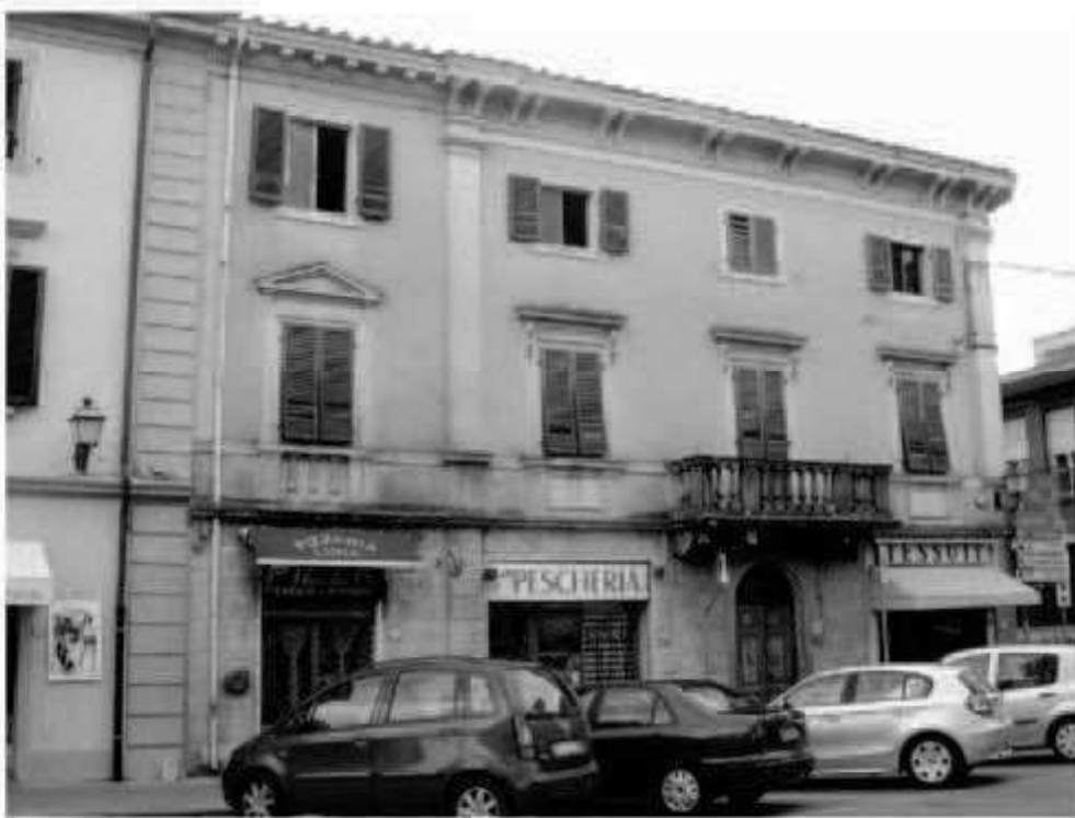
T4 piazza della Repubblica