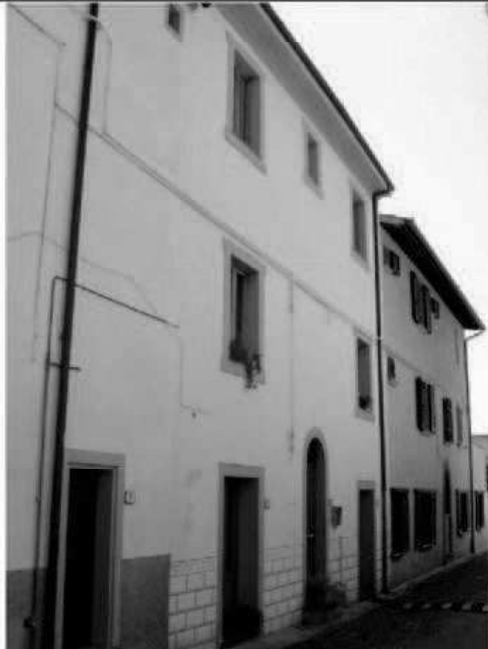
H3 via San Martino