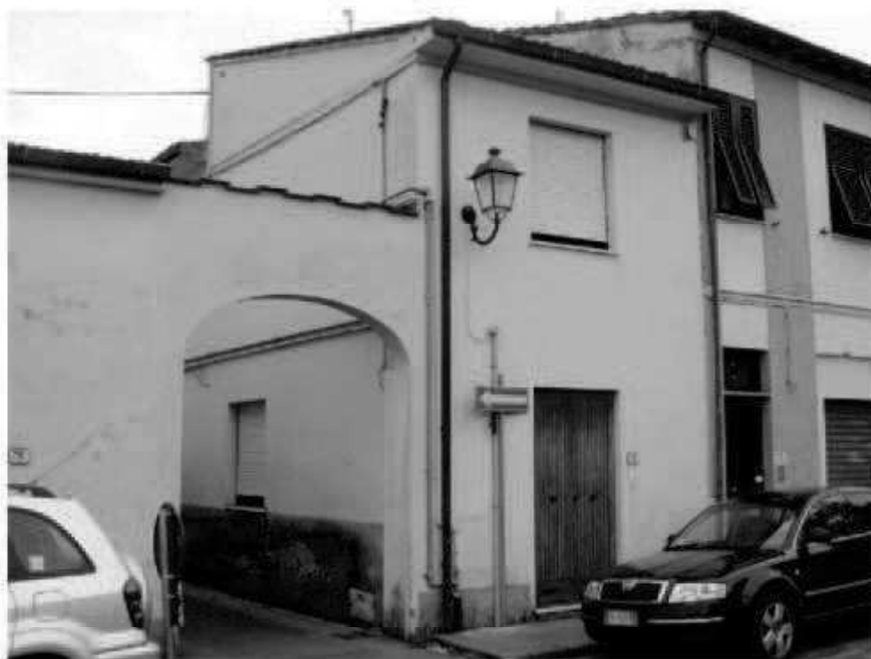
Q 9 via dei Mille