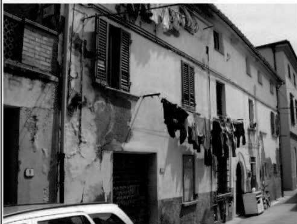
17 via Magenta