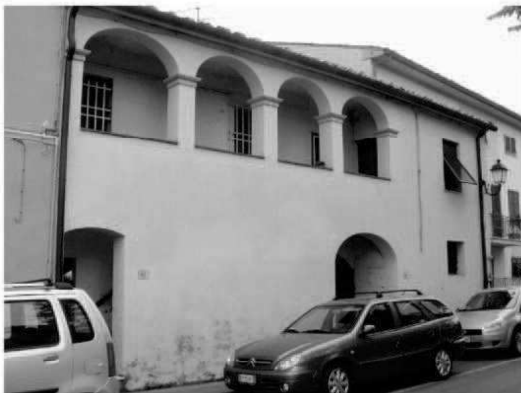
Q 7 via dei Mille