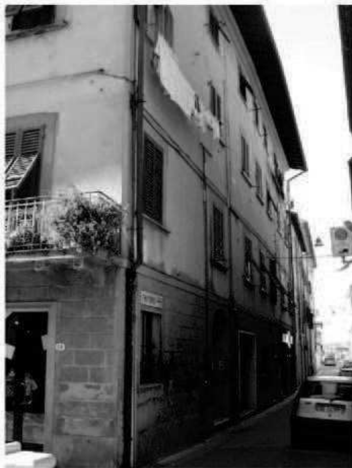
N 1 via Garibaldi