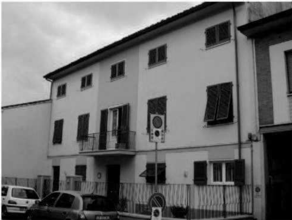
Q 6 via dei Mille