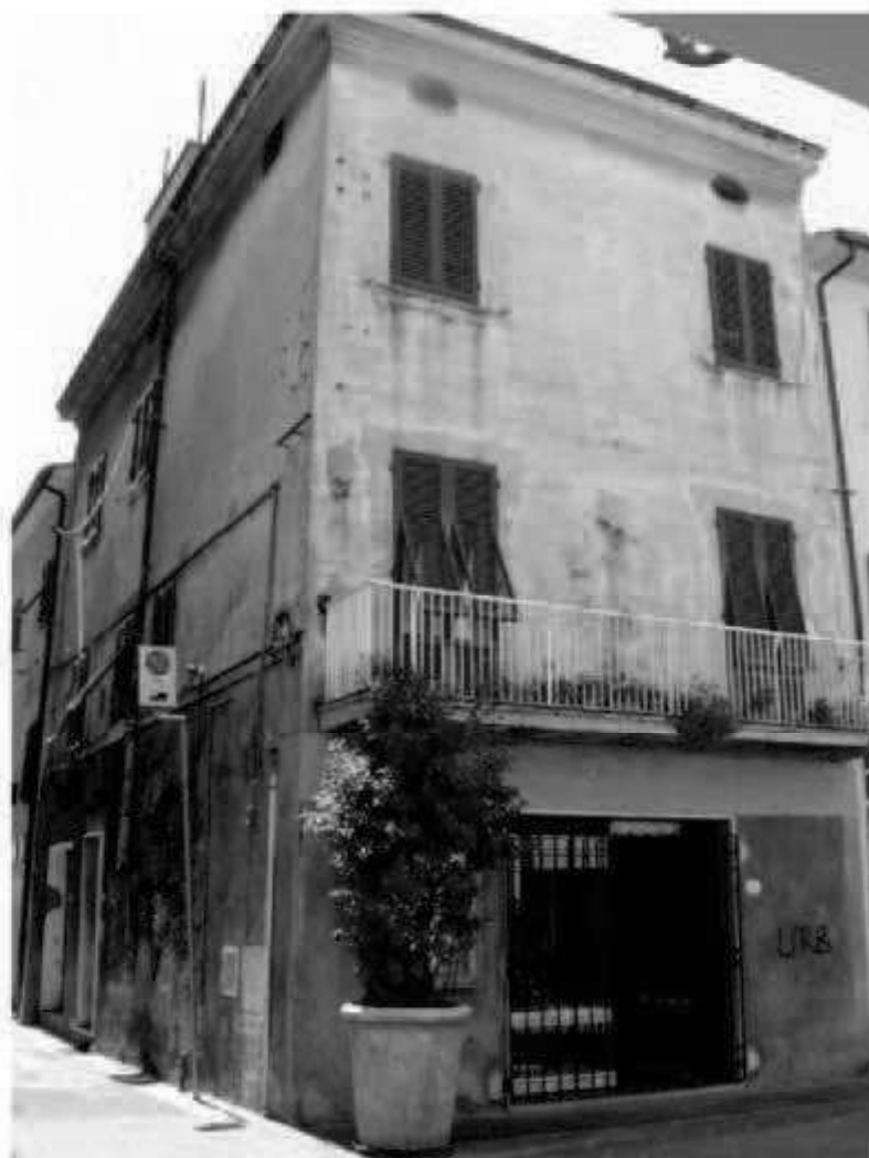
O 2 via Garibaldi - corso Matteotti