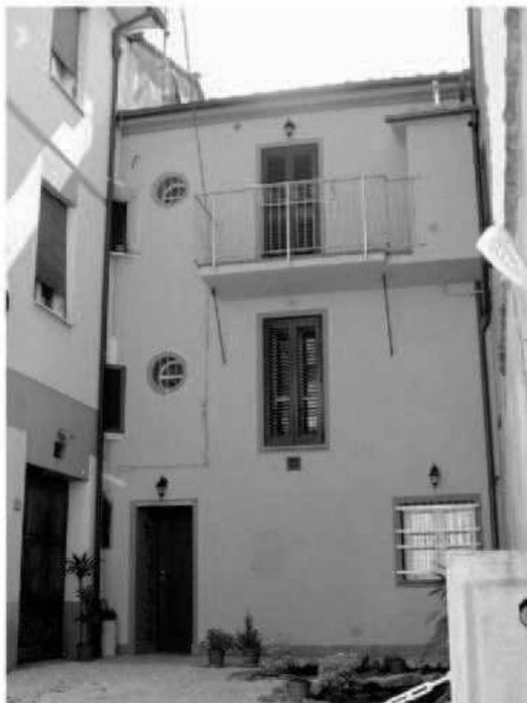
L6 via Montebello