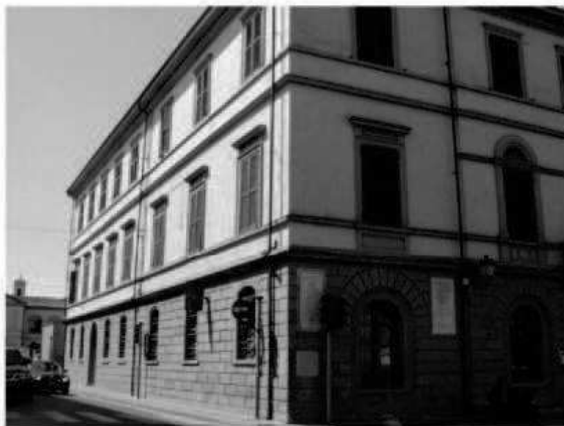
H1 via Battisti- piazza Valli