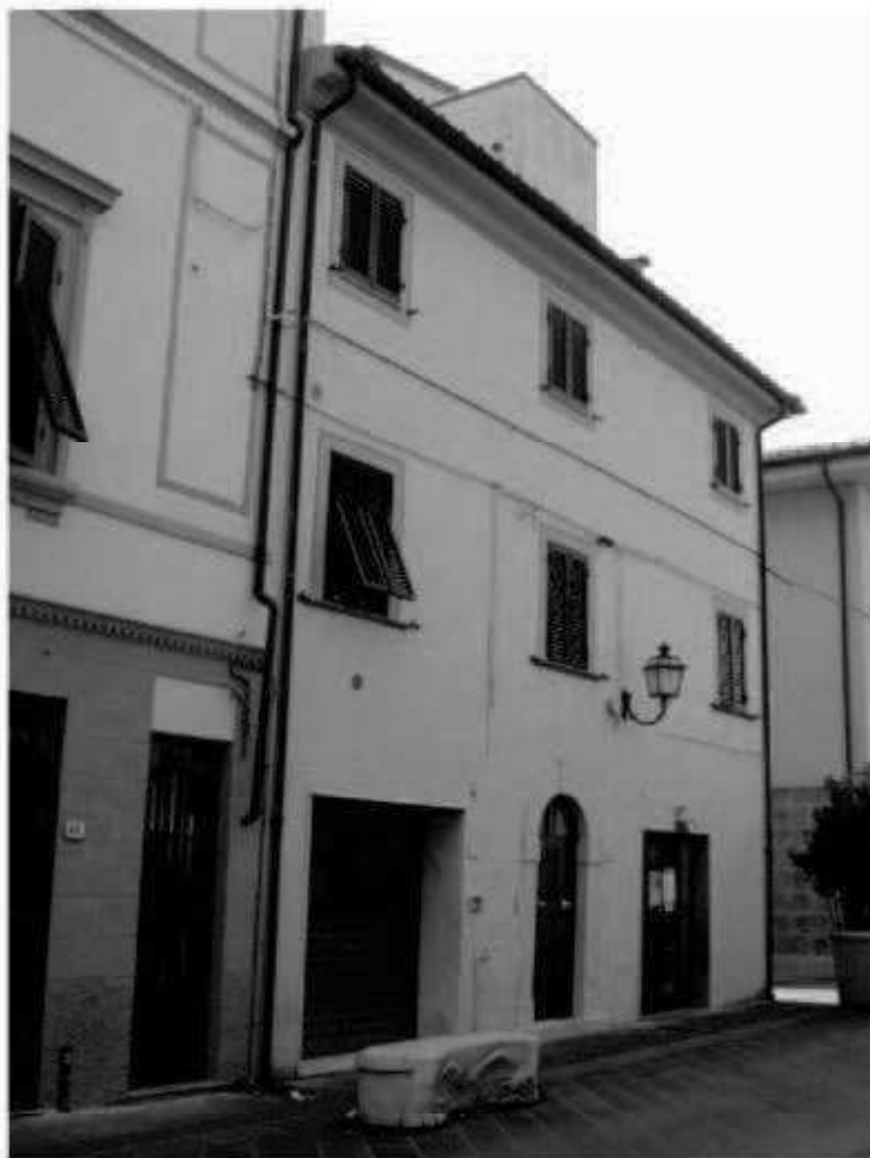
11 corso Matteotti -