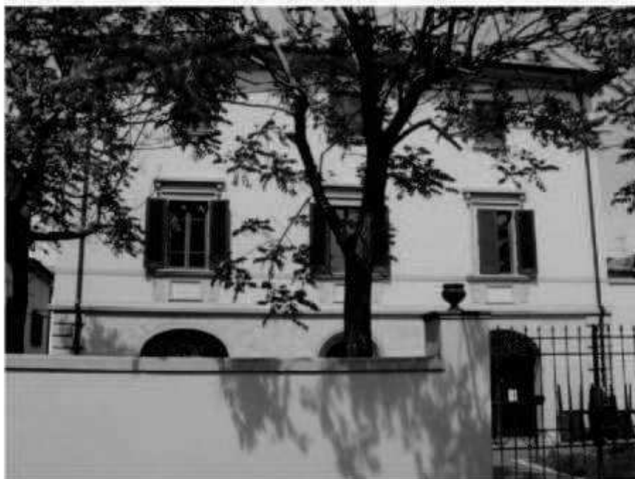
I 11 – via dei Mille