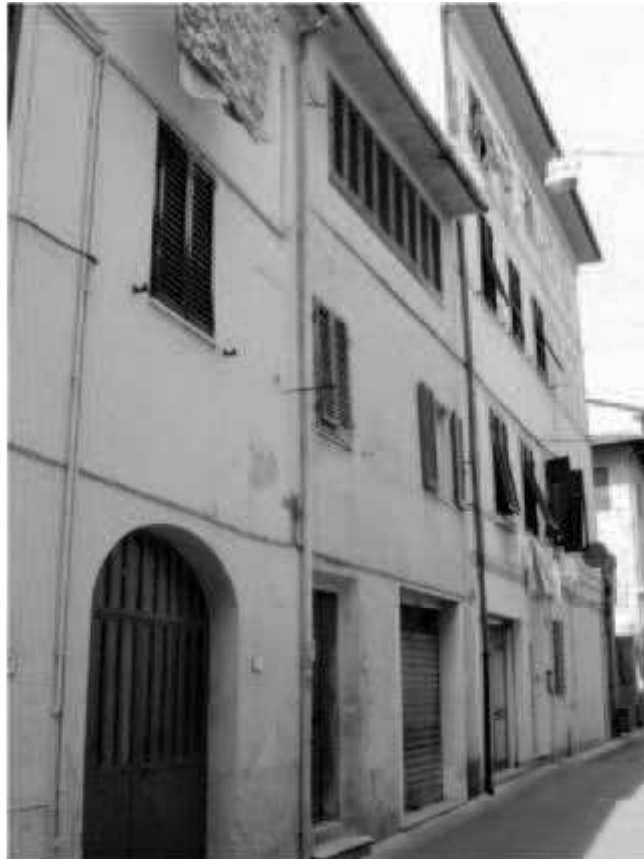
14 via San Martino