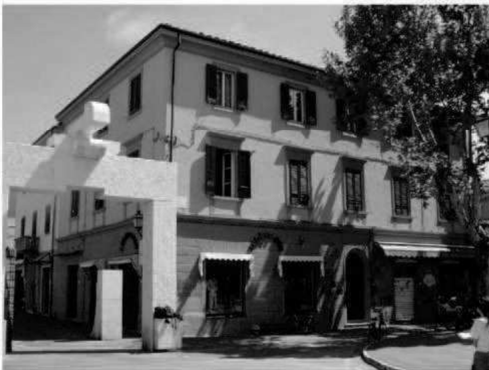
P.1 piazza della Repubblica- corso Matteotti