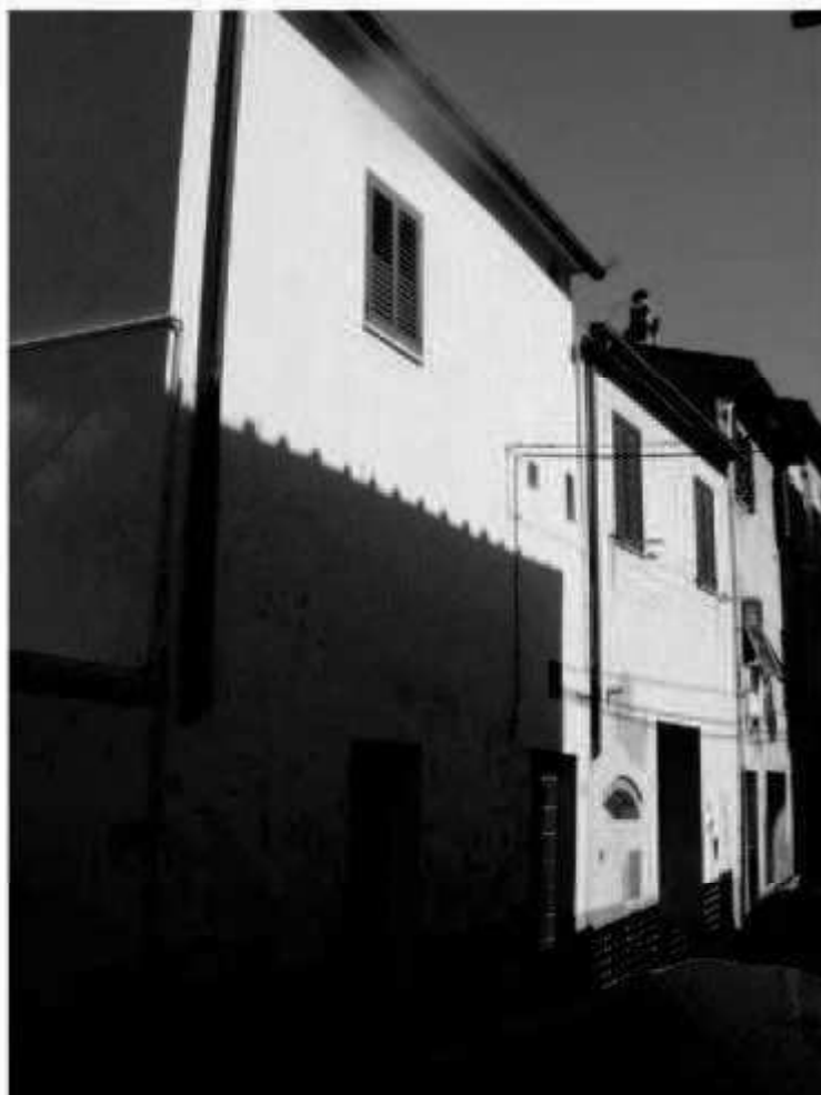
L 6 via Magenta