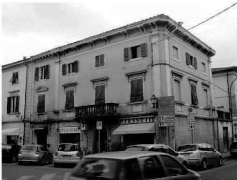
T 4 piazza della Repubblica- via Nazario Sauro