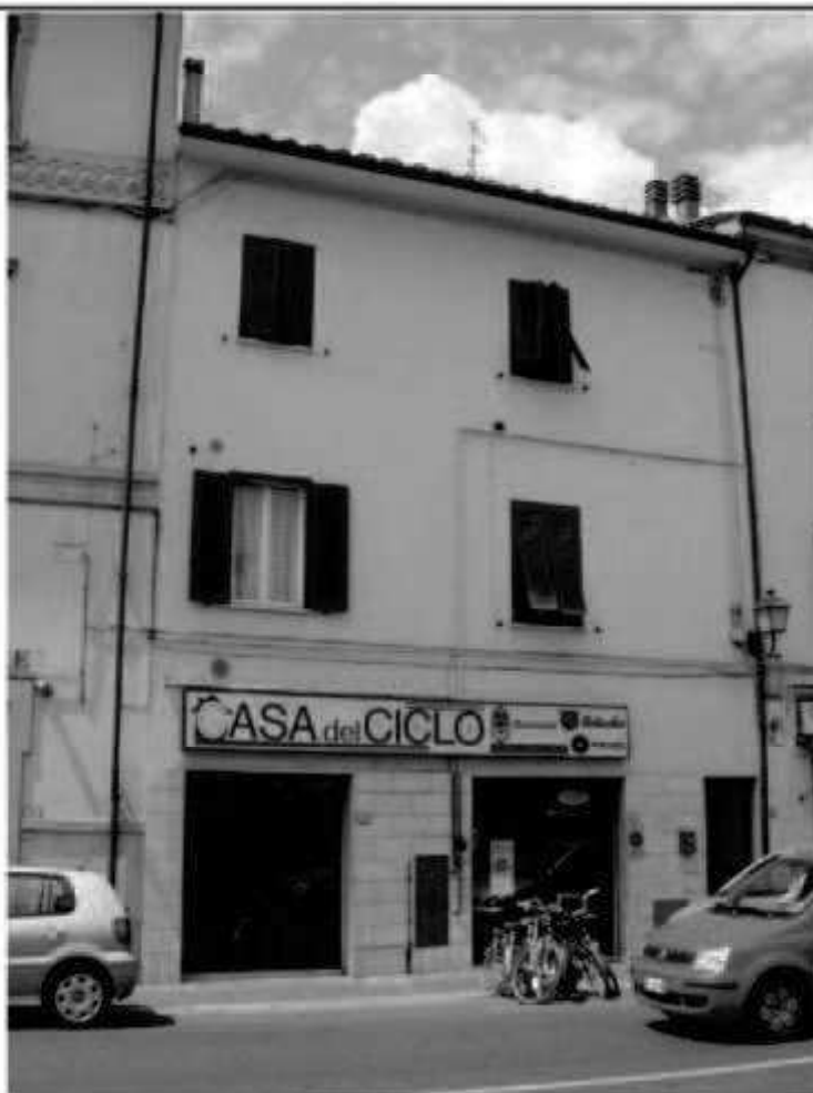
V 2 (piazza della Repubblica) via Roma