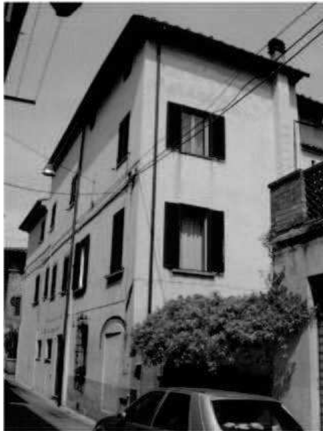
13 via Magenta