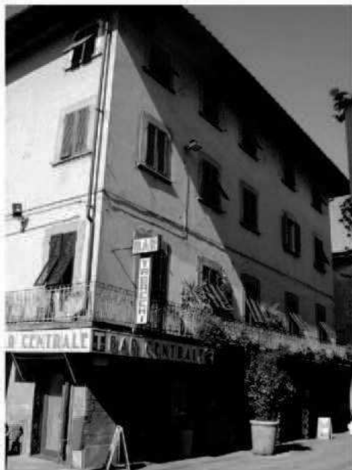
N. 1 piazza San Giovanni - corso Matteotti