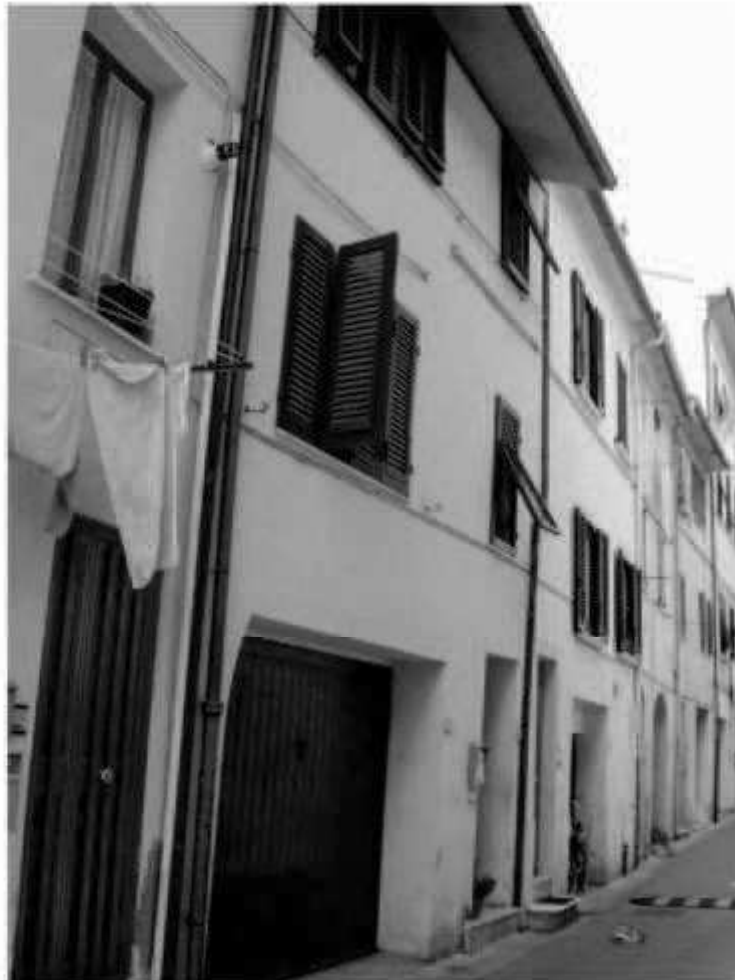
18 via San Martino