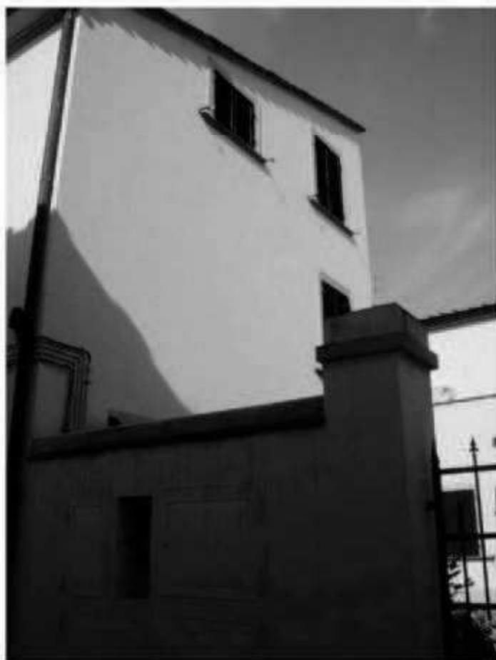
L 7d via Magenta