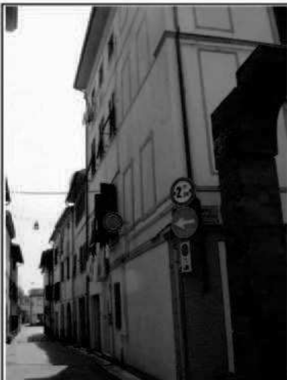
I 2 Via San Martino