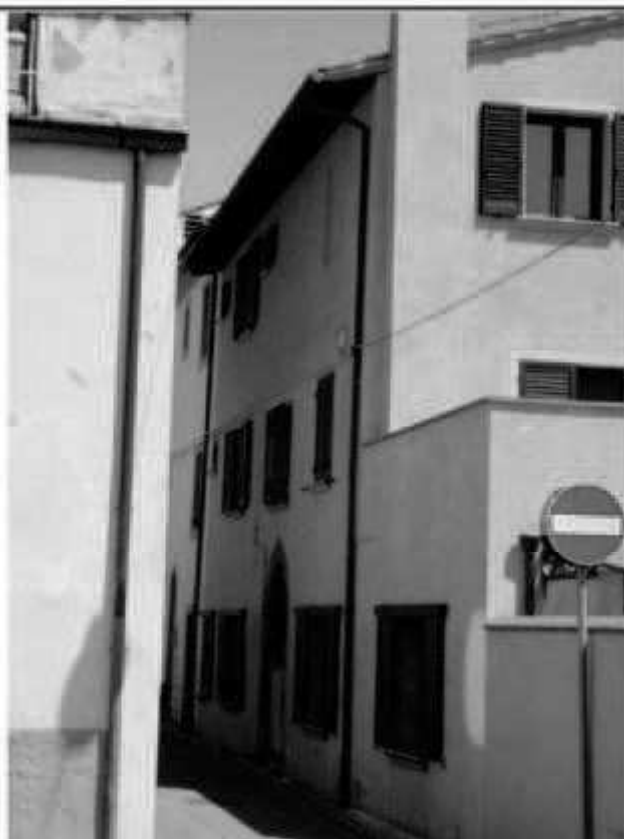
H 4 via San Martino