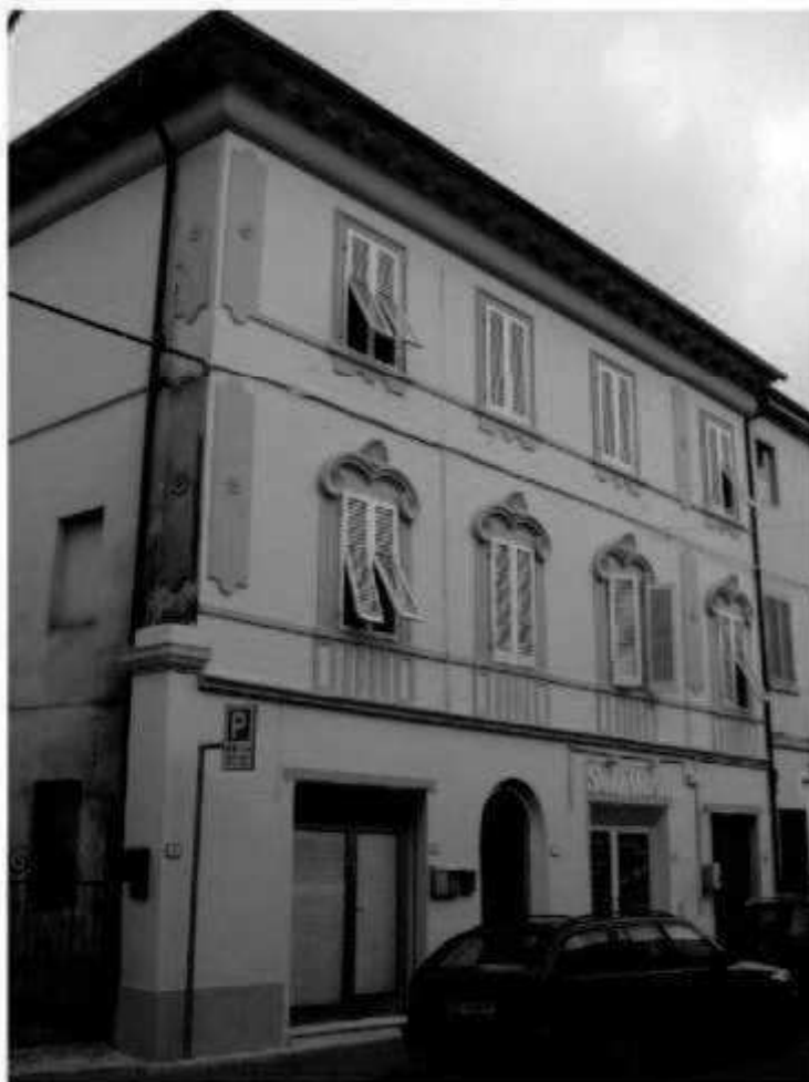
T 5 via Nazario Sauro