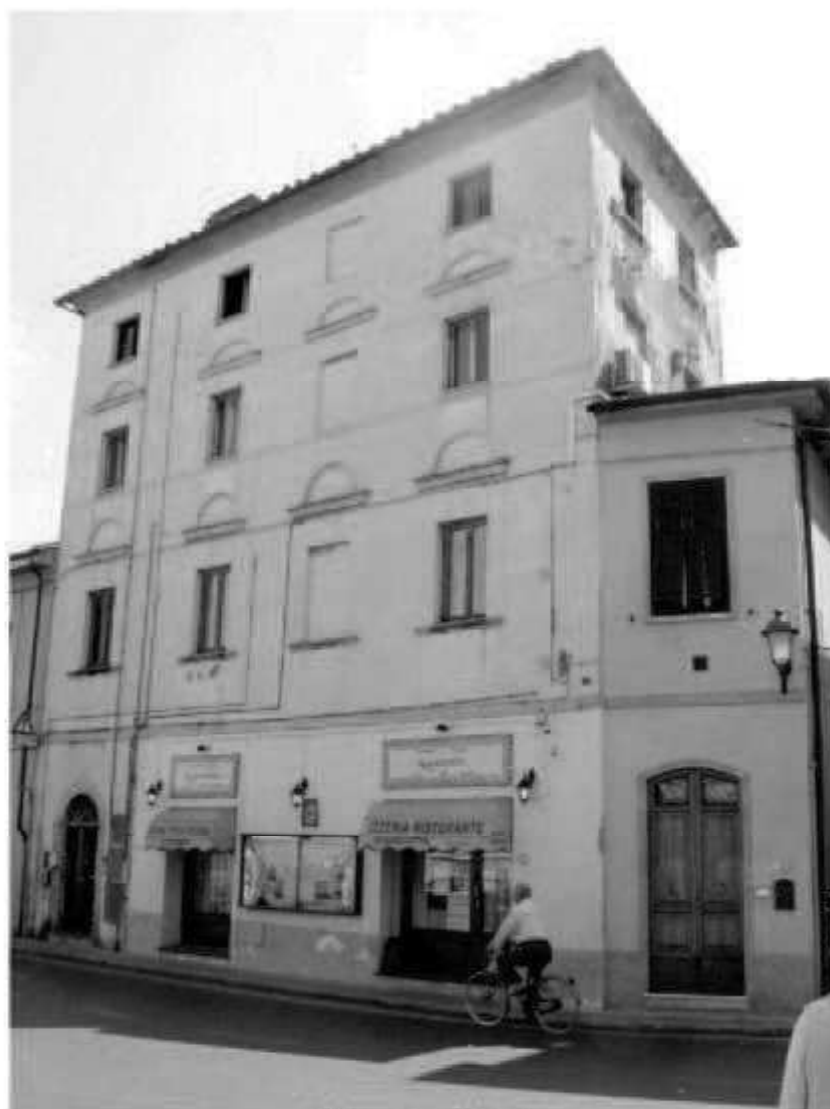
S 5 via Battisti