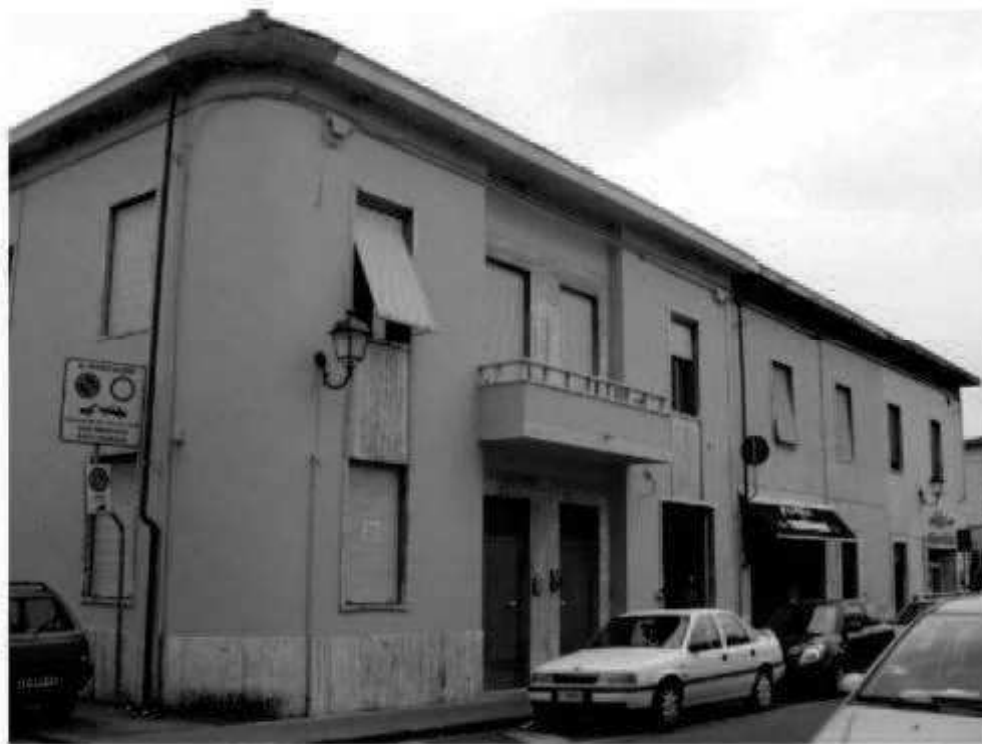
T 1 via dei Mille