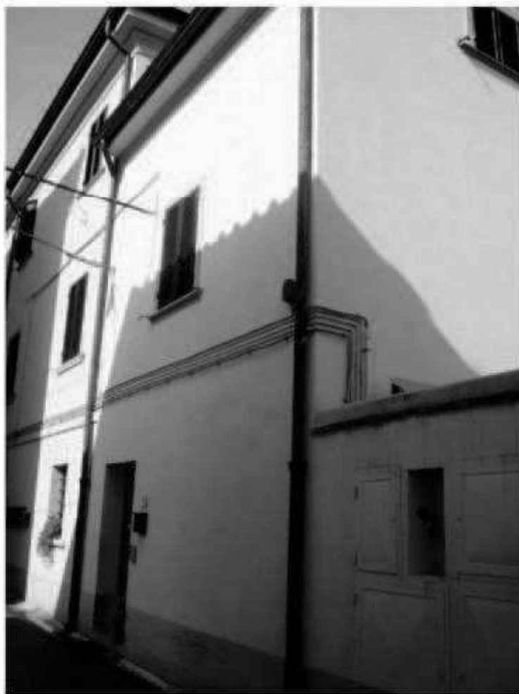
L 7d via Magenta