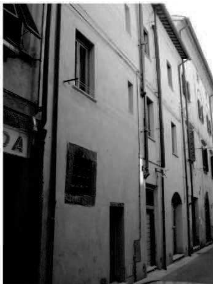
N 3 via Garibaldi