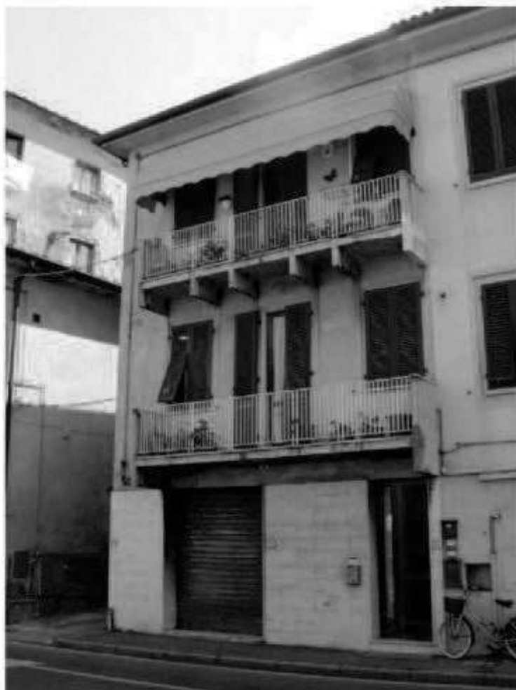
S 7 via Battisti