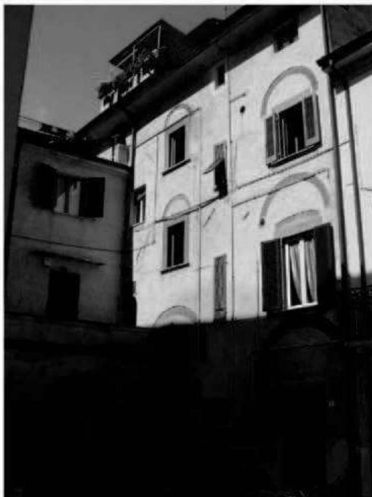
N 4 piazza San Giovanni