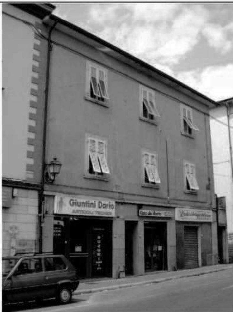
V.5 (piazza della Repubblica) via Roma