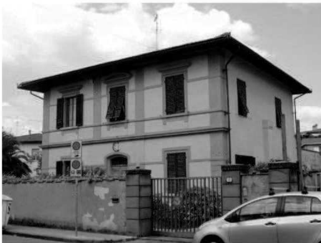
Z 1 via Carducci