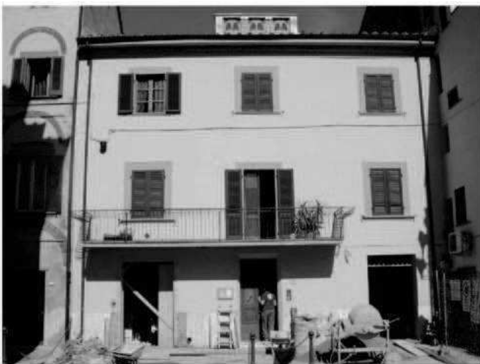
N 3 piazza San Giovanni