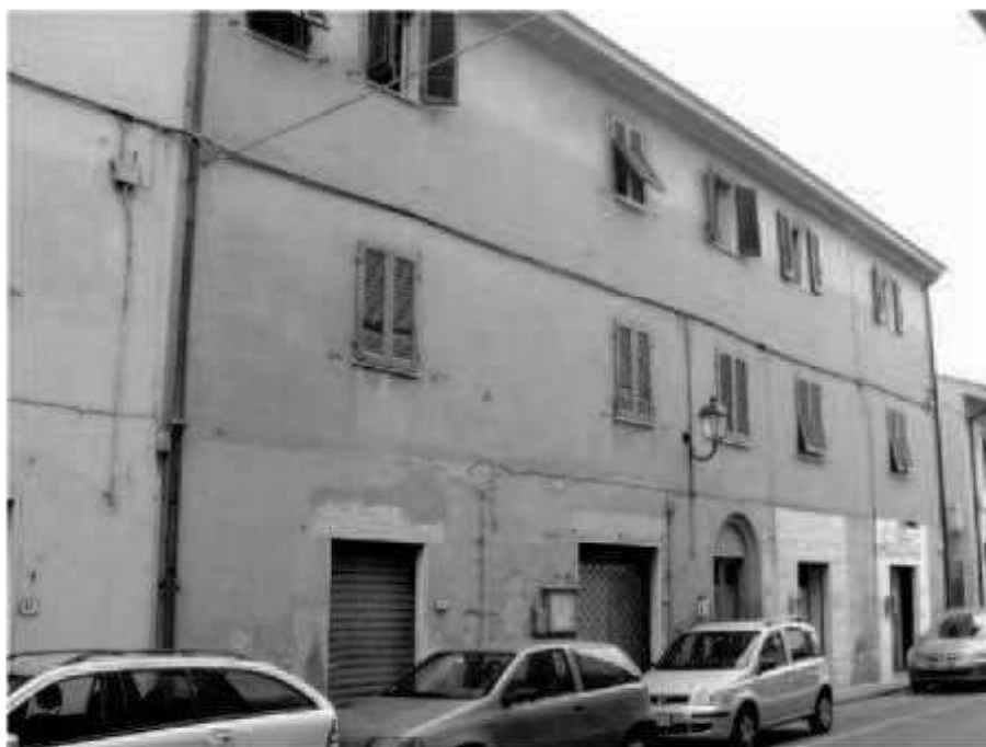
Q 2 via dei Mille