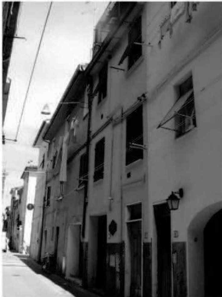
O 4 via Solferino