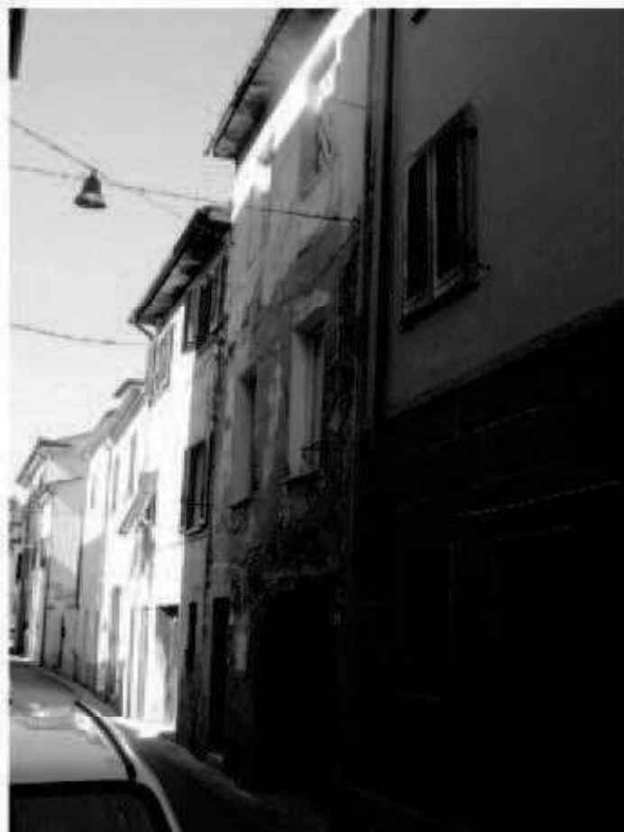
L 4 via Magenta