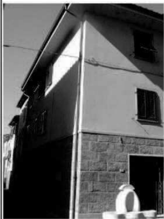
L 2 via Magenta