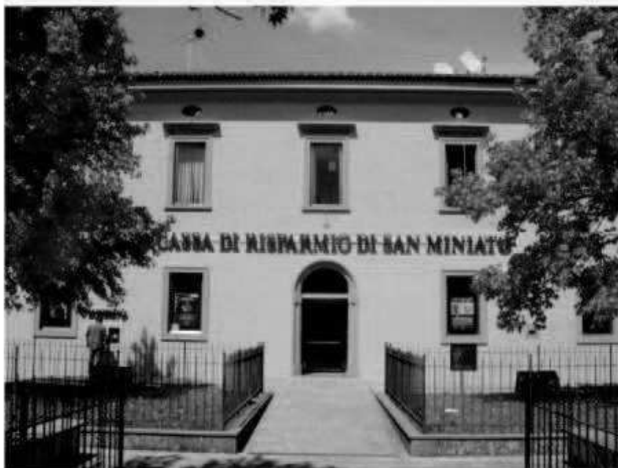
P6 via dei Mille