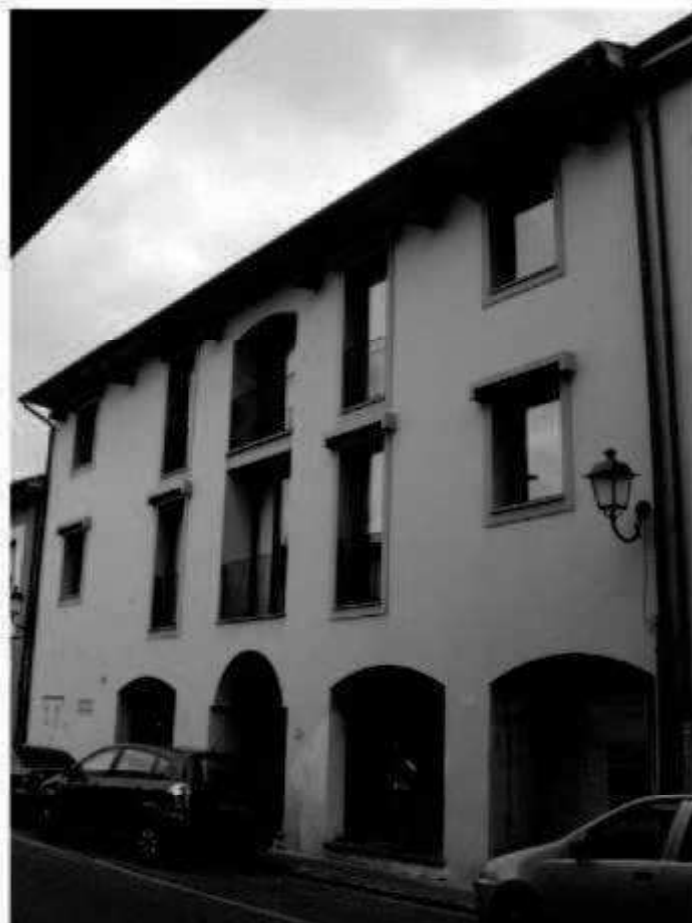
Q 4 via dei Mille