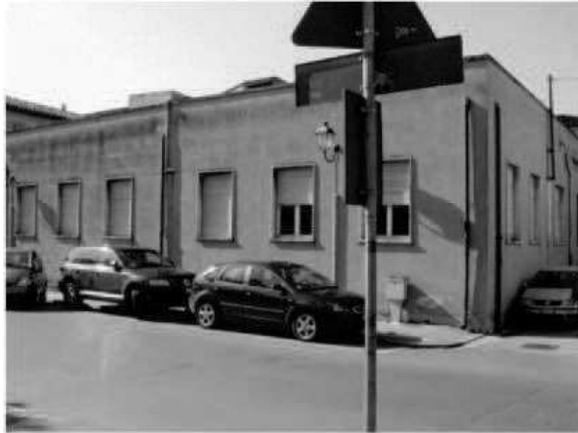
G 6 via Carducci - via Mazzini