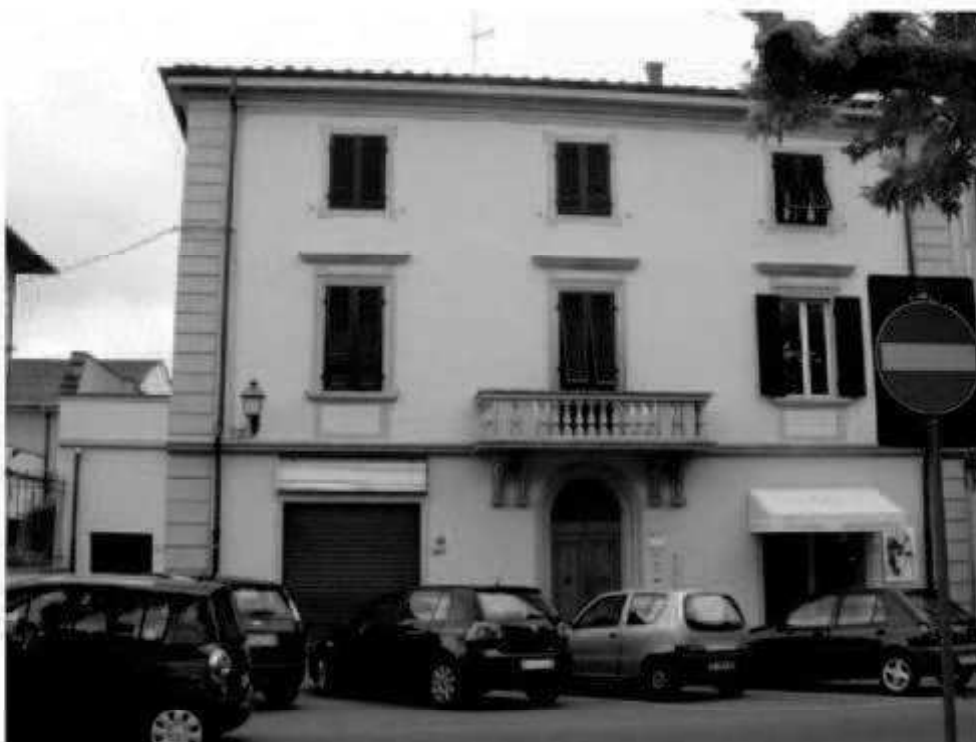
T 3 piazza della Repubblica