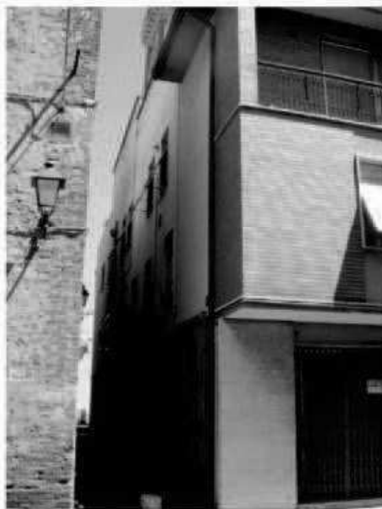
M4b - via Montebello - via Dei Mille