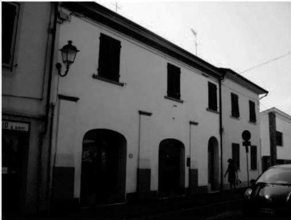
S 8 via Battisti