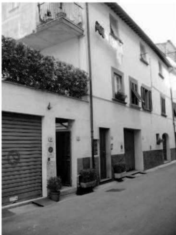
08c: via Garibaldi