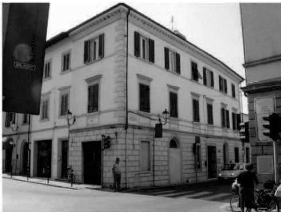
S 1 via Marconi - via Battisti