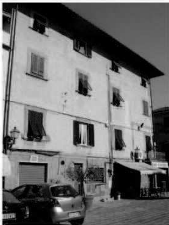
N 1 piazza San Giovanni -