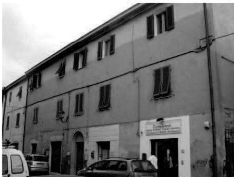
Q 2 via dei Mille