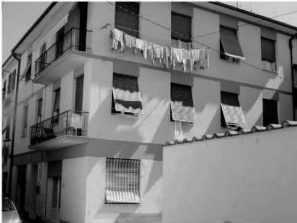
L 3 via Montebello