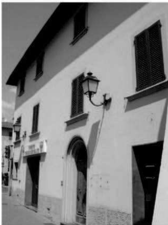
R3 via Marconi