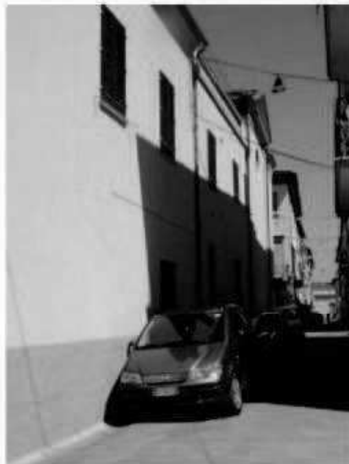
M 3 - via Montebello