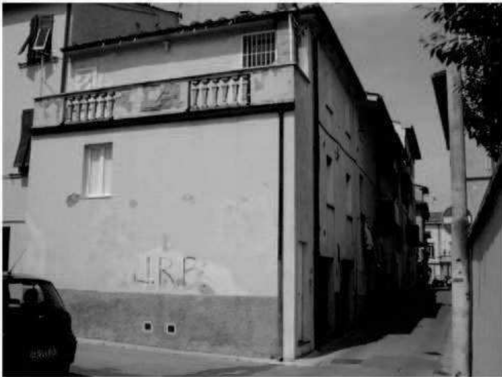
110 via San Martino