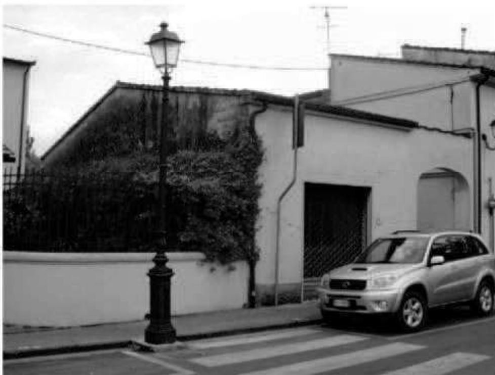
Q 10 via dei Mille