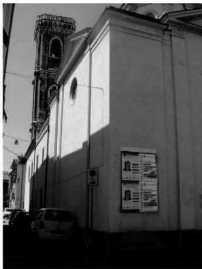
M 2 piazza San Giovanni