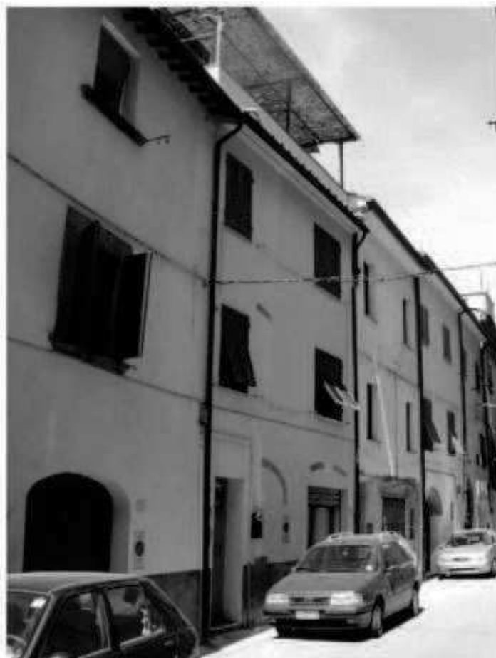
0 7 via Garibaldi