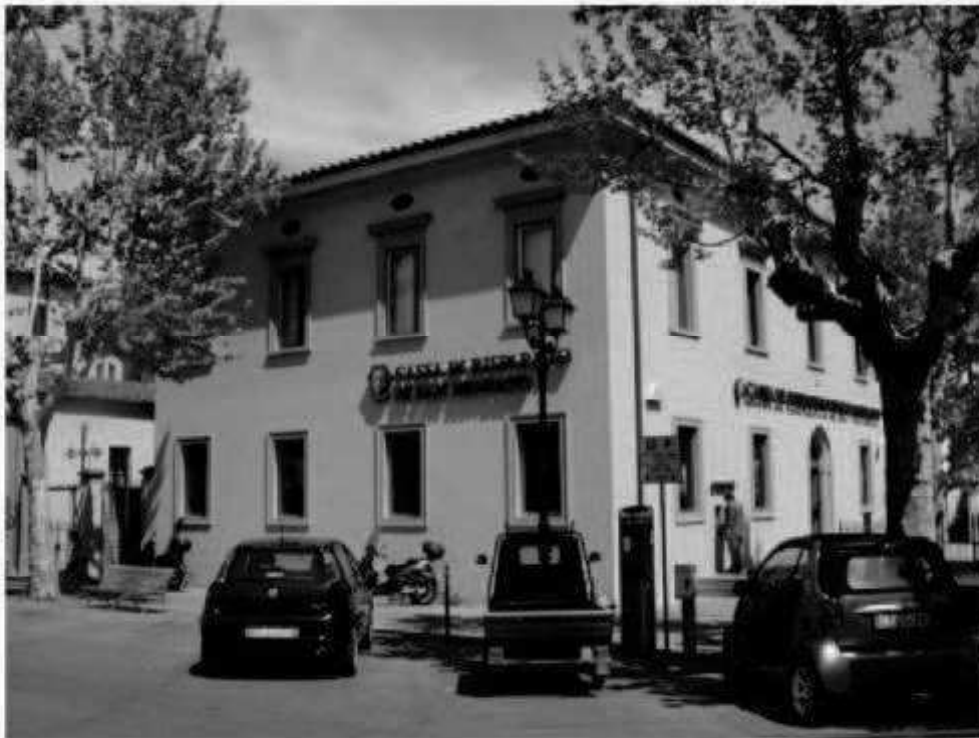
P 6 piazza della Repubblica