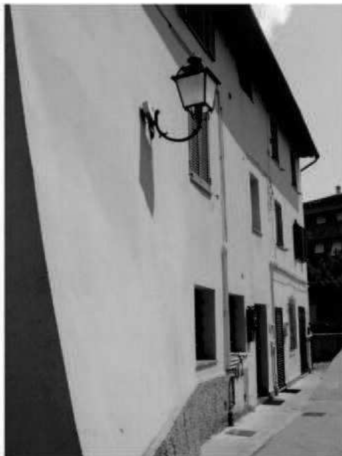
R 4 via Marconi