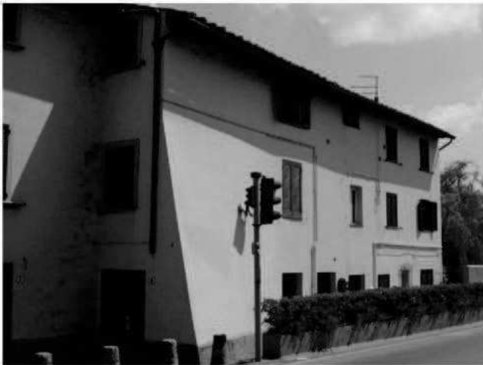
R 4 - via Marconi