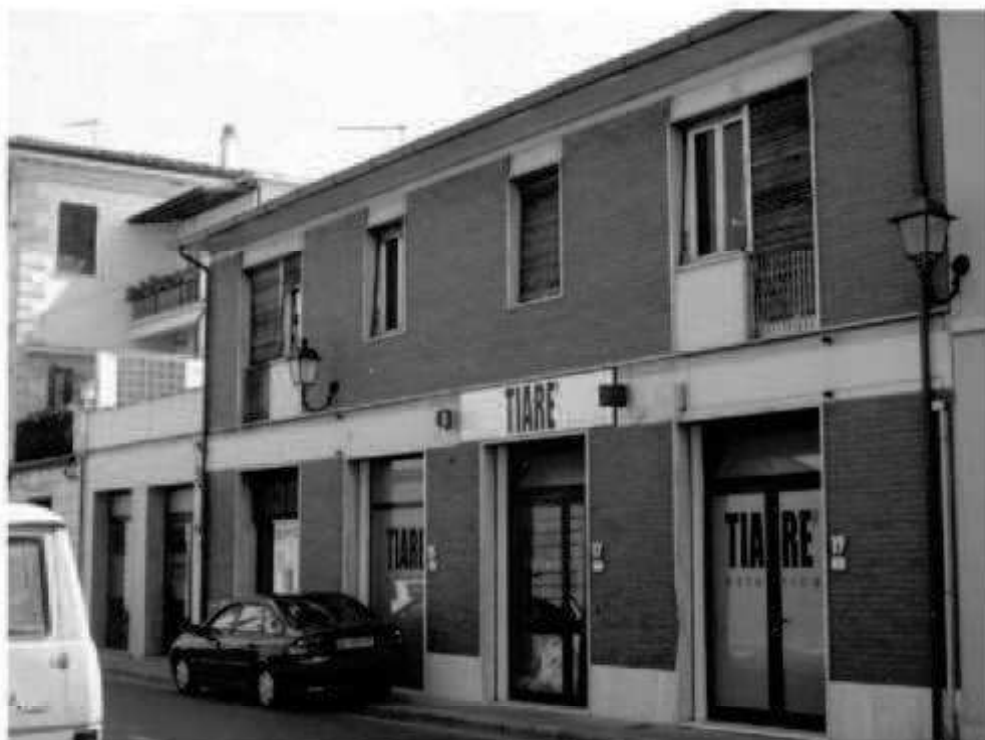
S 3 Via Battisti