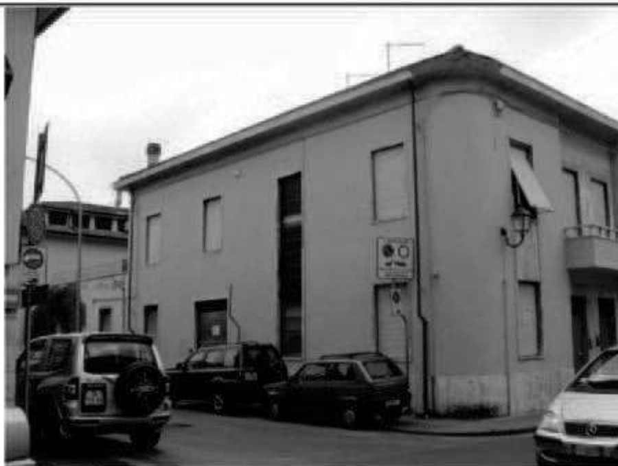
T1 via don Minzoni