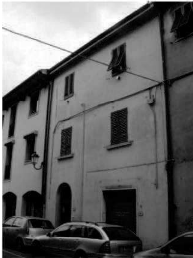
Q 3 via dei Mille