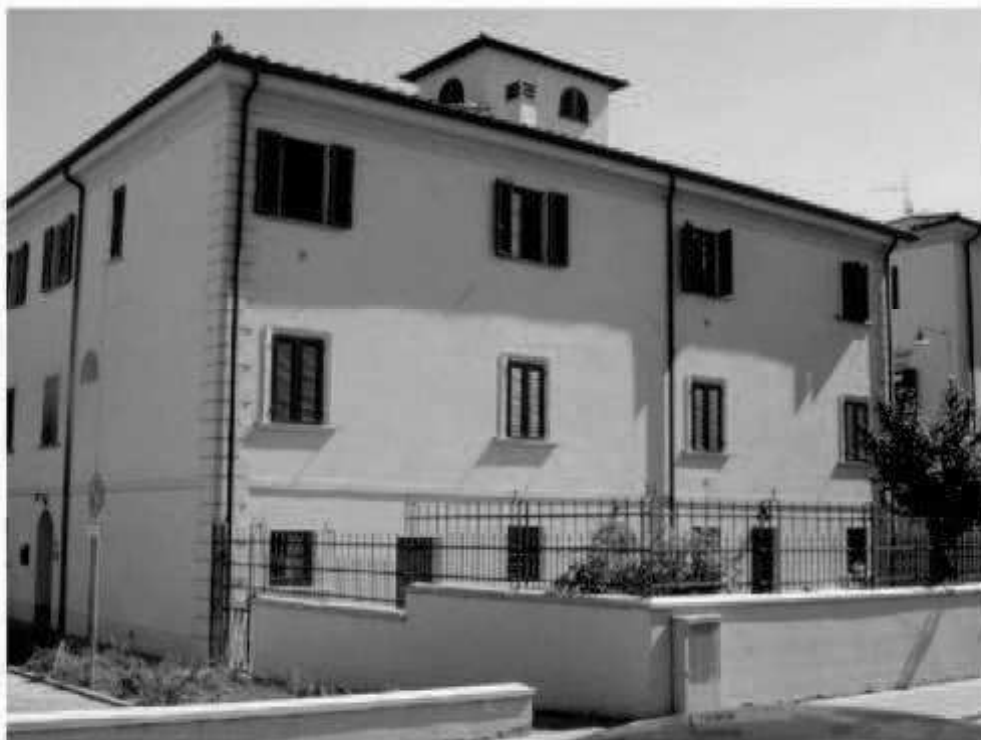
L 7c via dei Mille - via Montebello