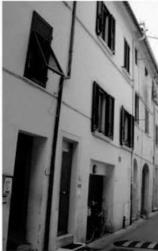
16 via San Martino