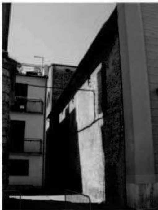
M 1 piazza San Giovanni