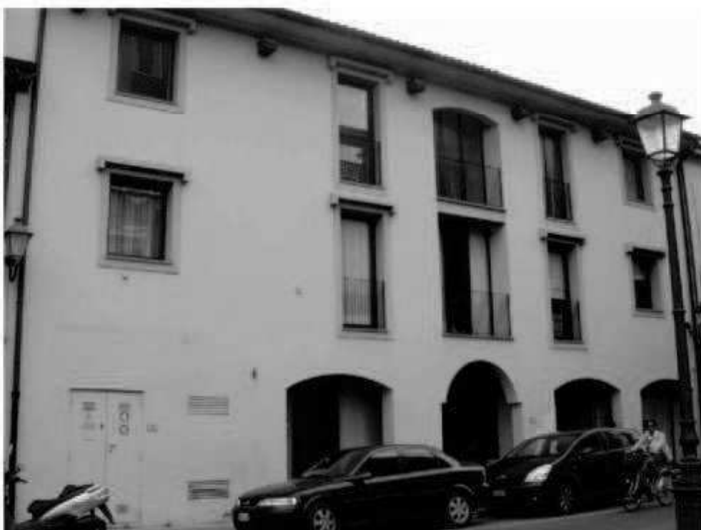
Q 4 via dei Mille