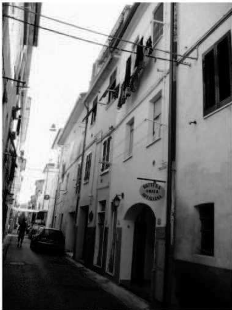
O8a via Solferino