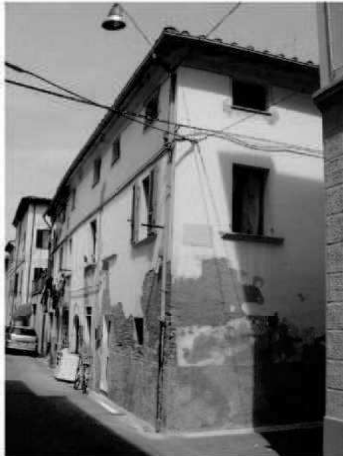
17 via Magenta