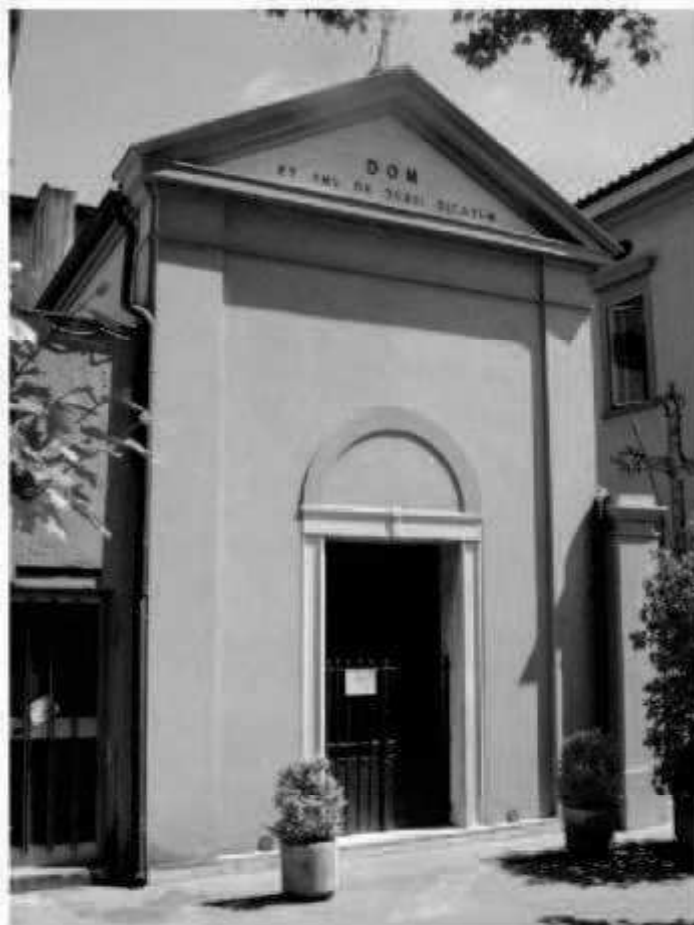
P 4 piazza della Repubblica