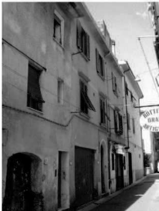
P 3 via Solferino