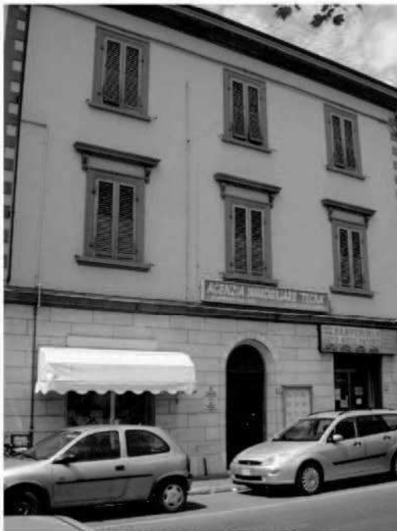
V 4 (piazza della Repubblica) via Roma