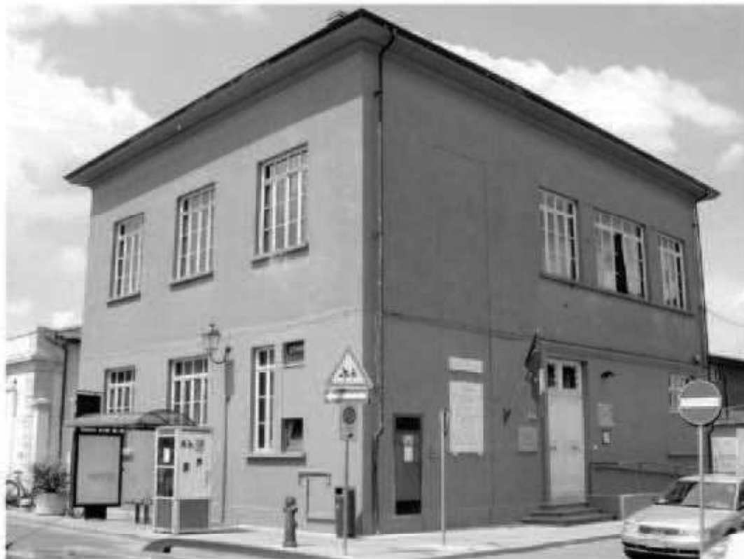
Z 4: via Carducci- piazza caduti di Cefalonia e Corfù