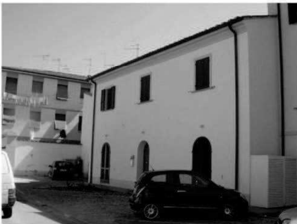
L.7b - via Montebello