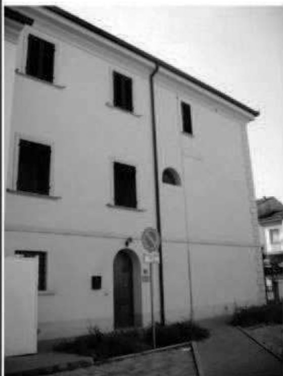
L7c via Montebello