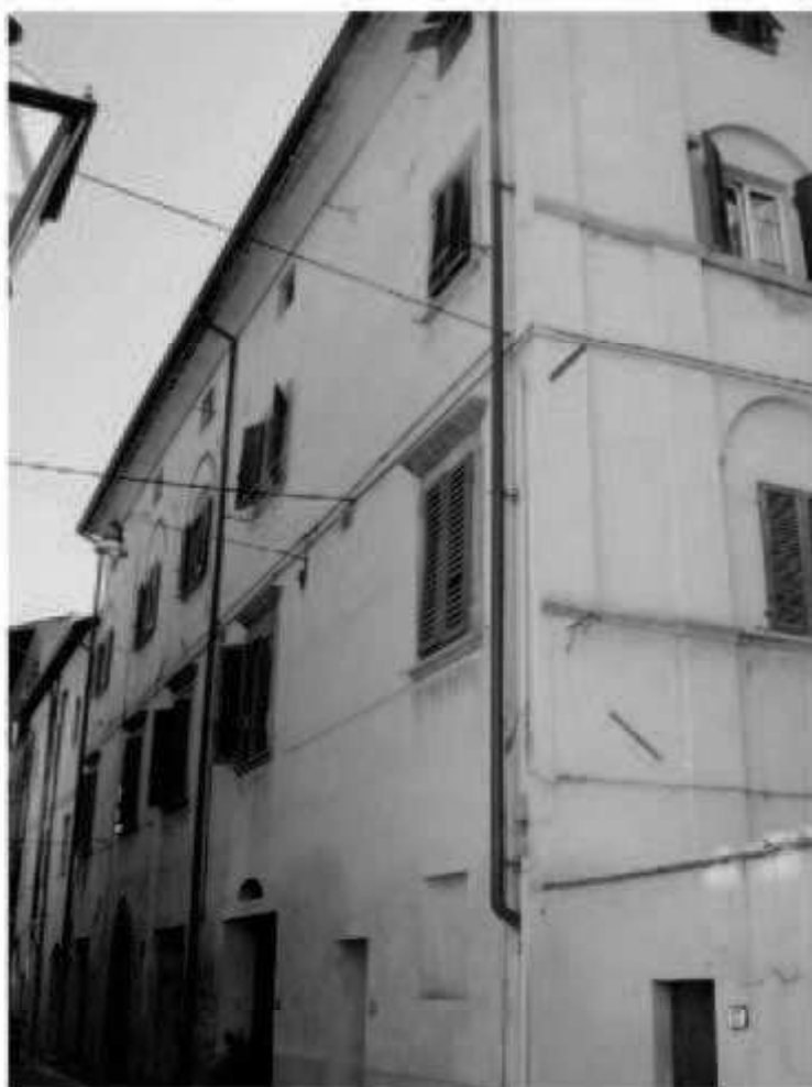
N 4 - via Garibaldi