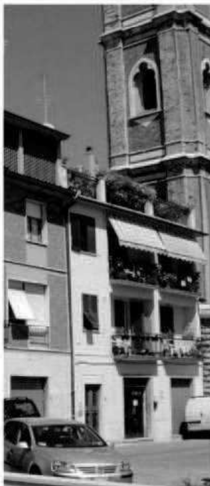
M4a via Montebello