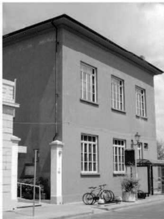
Z4 – via Carducci