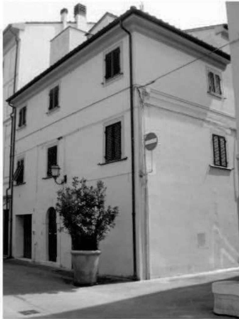
11 corso Matteotti - via Magenta