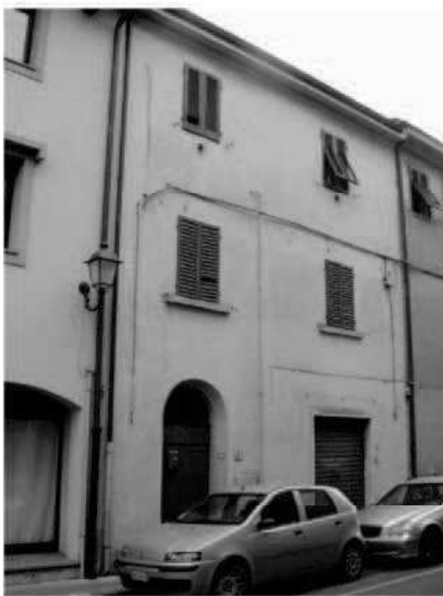
Q 3 via del Mille