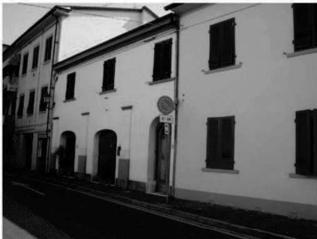
S 8 via Battisti