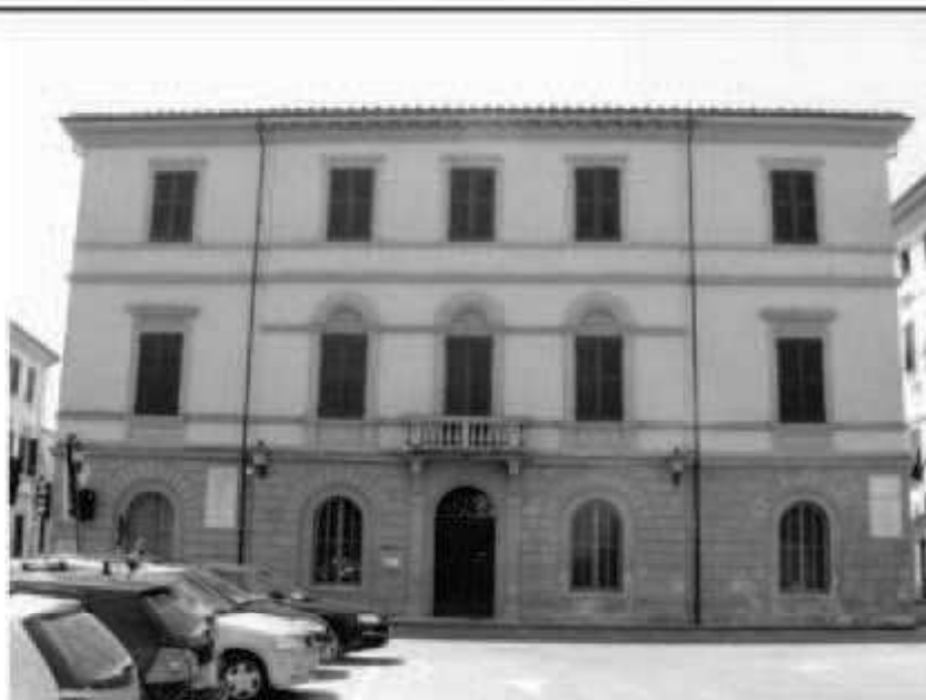
H 1 piazza Valli