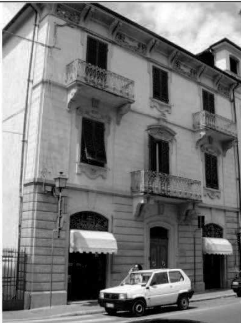
1 (piazza della Repubblica) via Roma