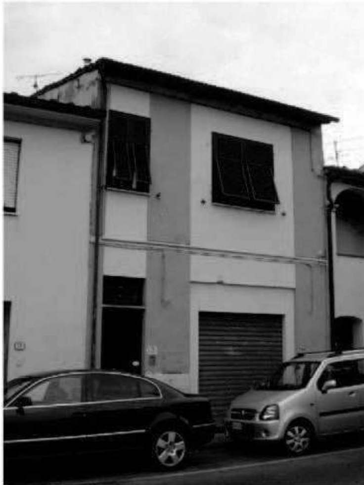
Q 8 via dei Mille