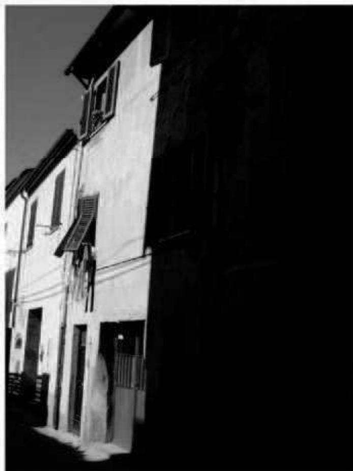
L 5 via Magenta