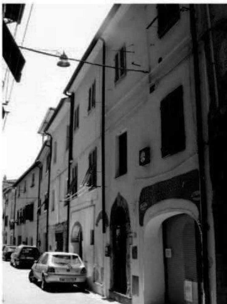
0 5 via Garibaldi