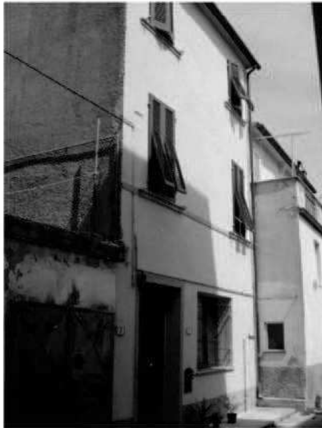
19 vicolo Mozzo