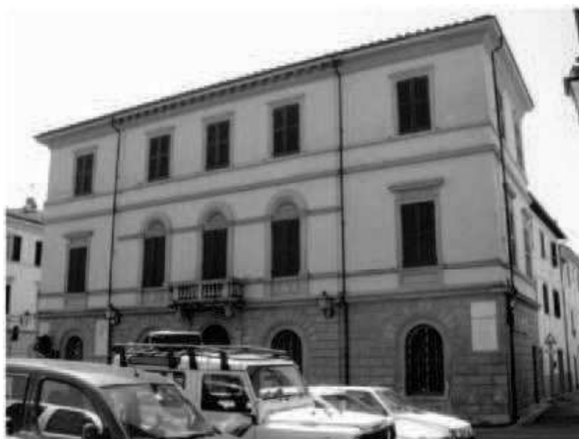
H 1 piazza Valli- via san Martino