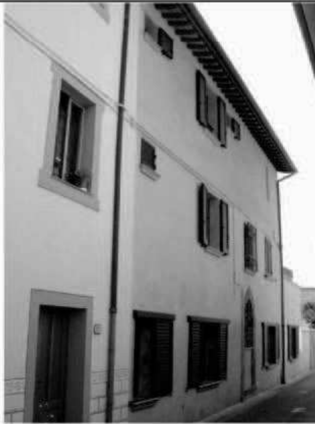
H 4 via San Martino