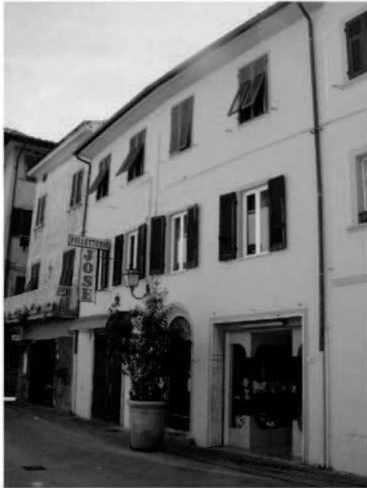
01 corso Matteotti