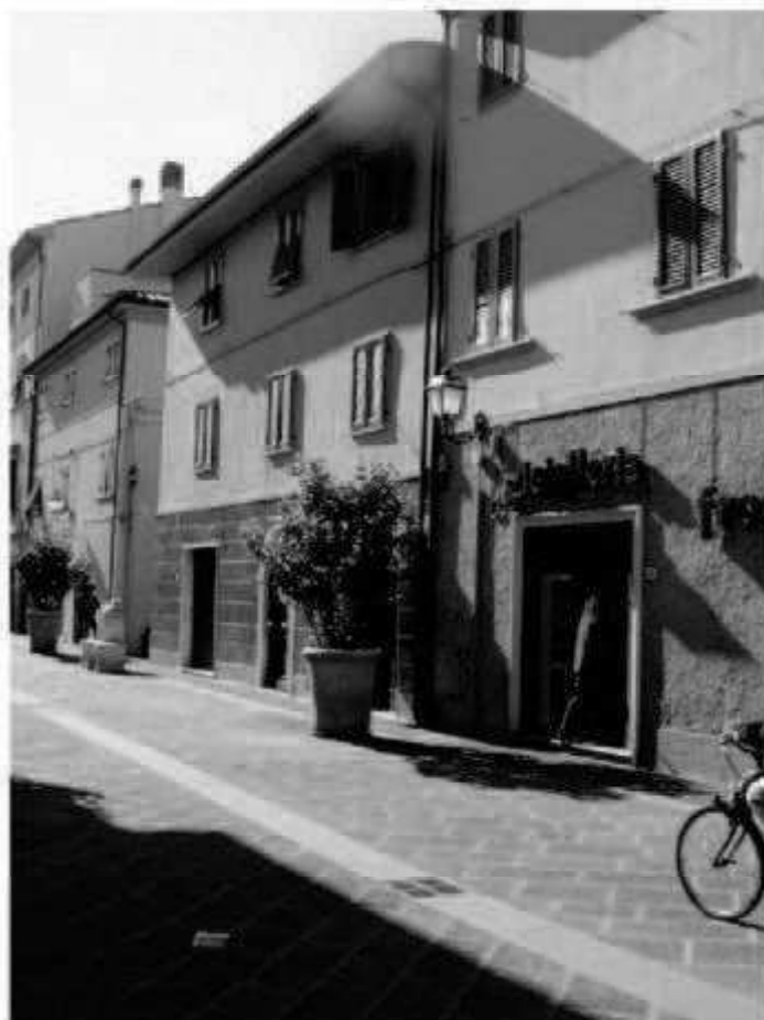
L 2 via Matteotti - via Magenta