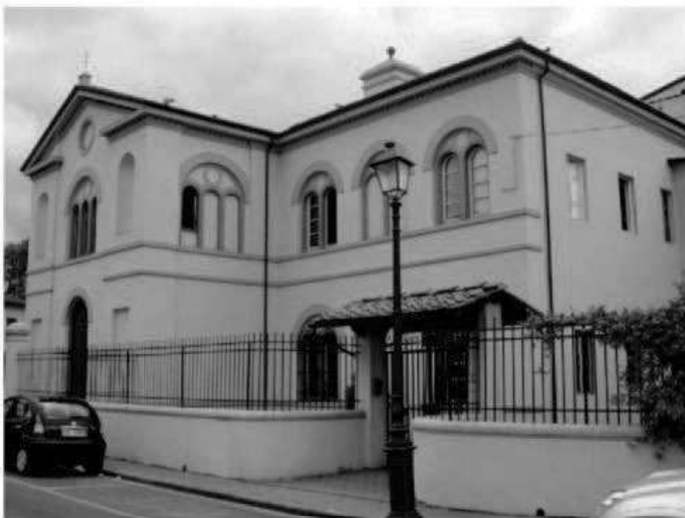
Q 11 via dei Mille -