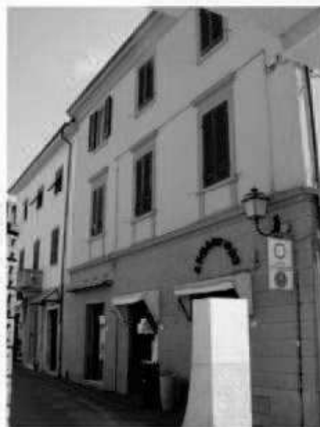
P 1 corso Matteotti