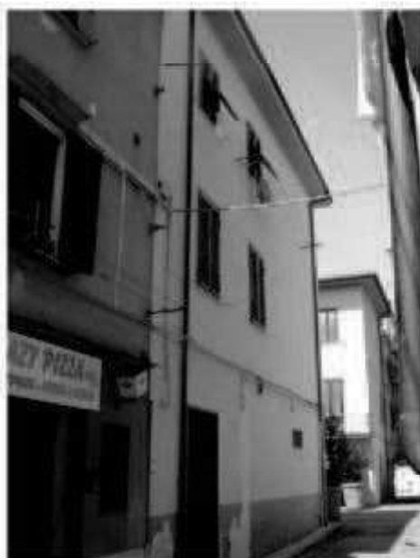
P2 via Solferino