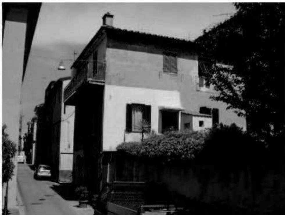
O 8d via Solferino