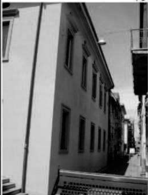
P6 via Solferino