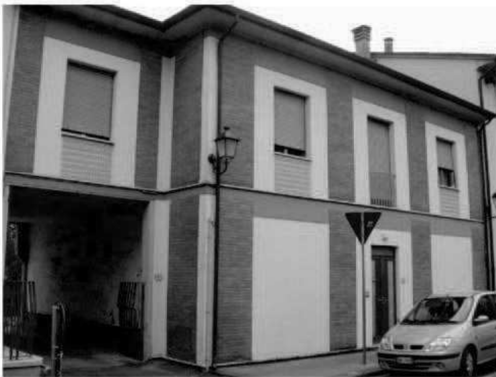
Q 5 via dei Mille