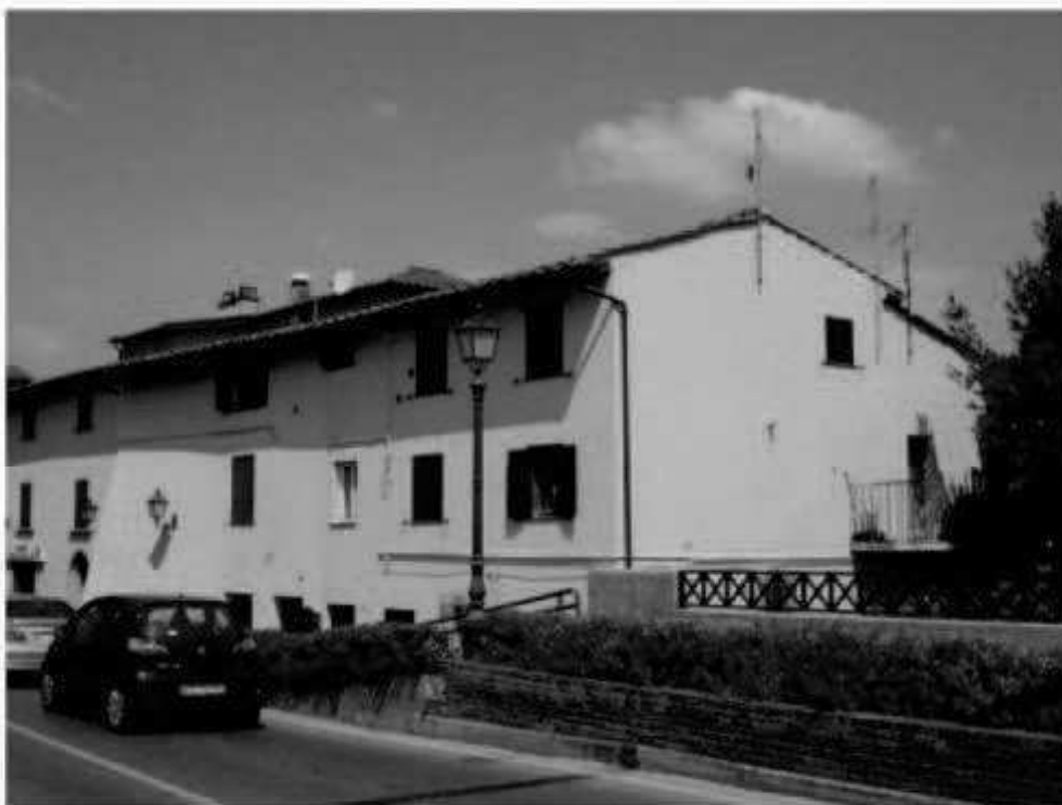
R 4 via Marconi