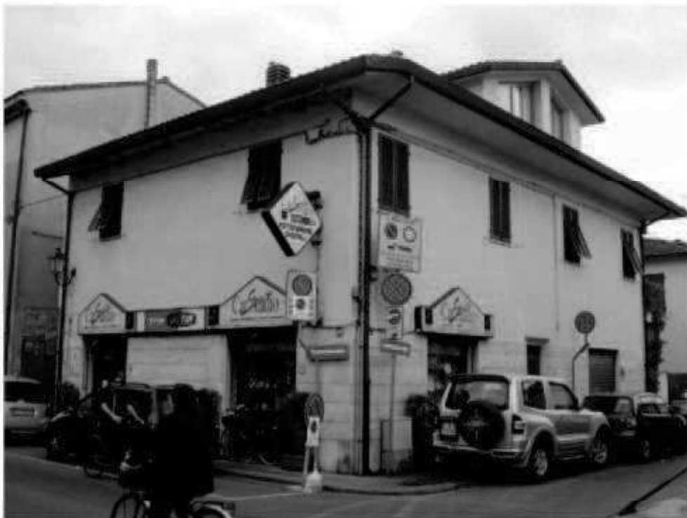
Q 1 via dei Mille- via don Minzoni