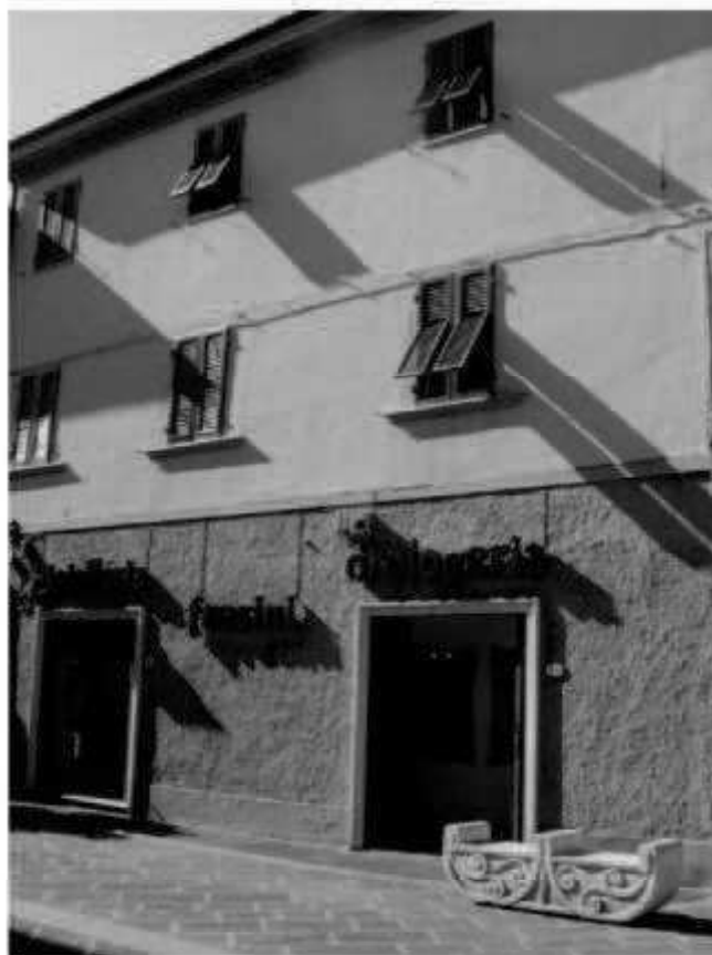
L 1 via Montebello - via Matteotti