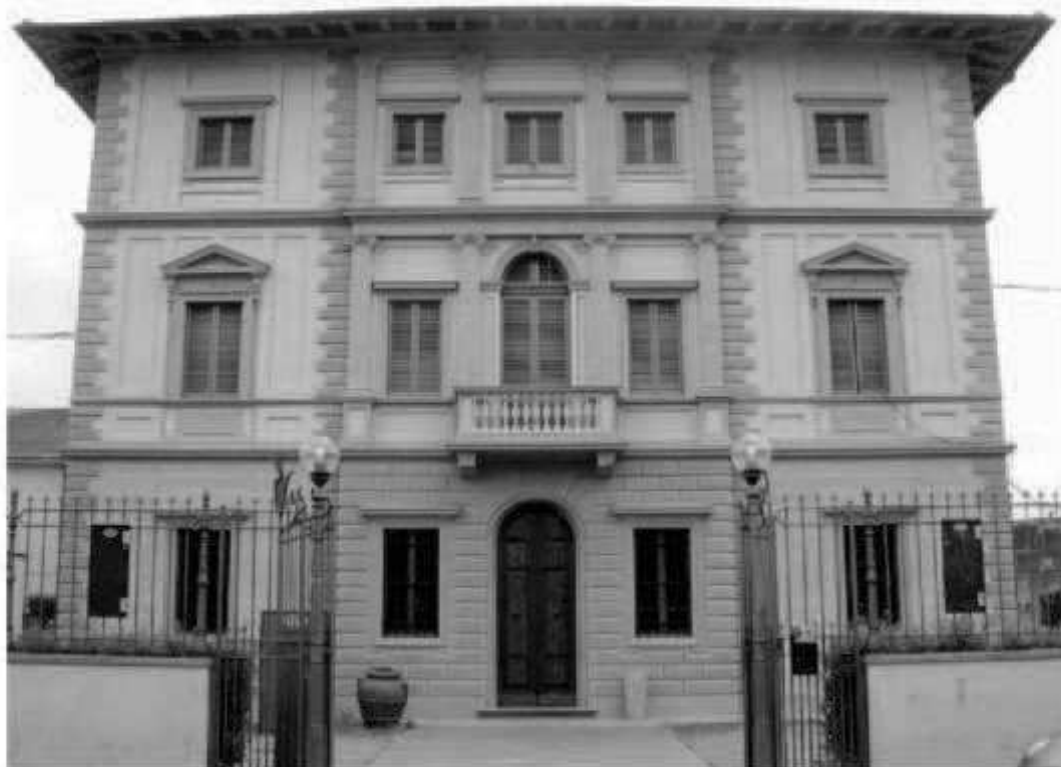
T 2 via dei Mille