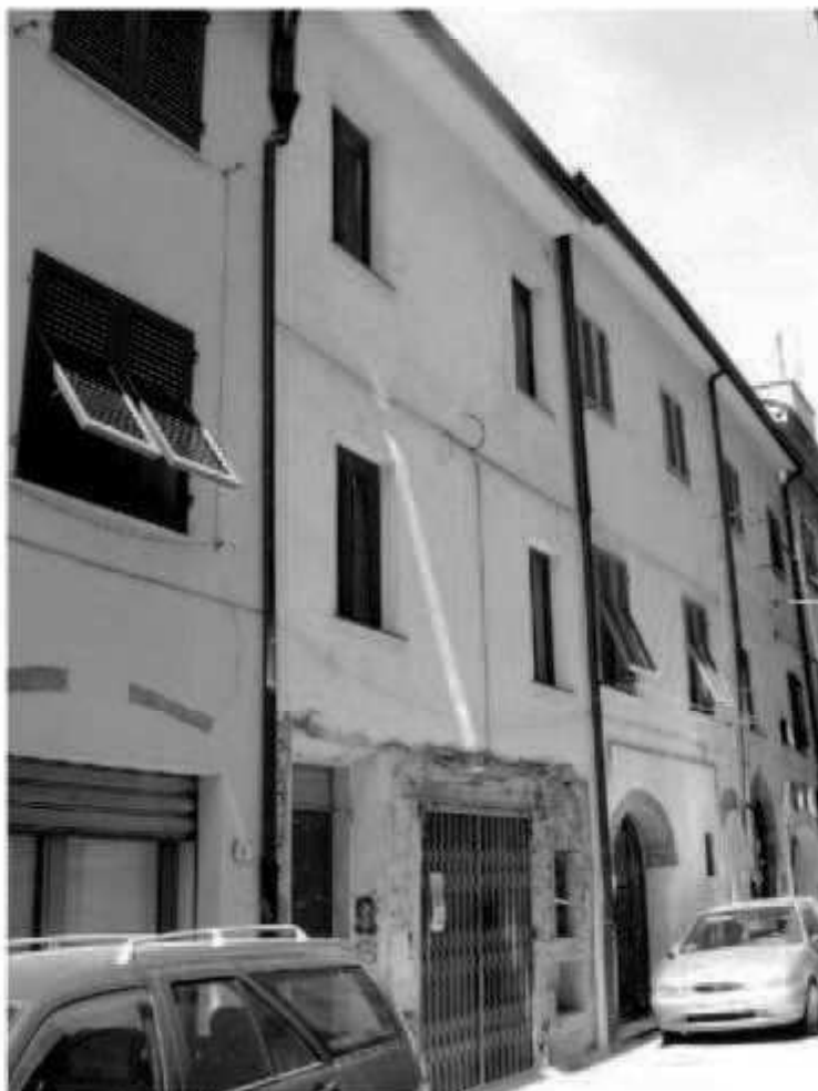
O 6 via Garibaldi