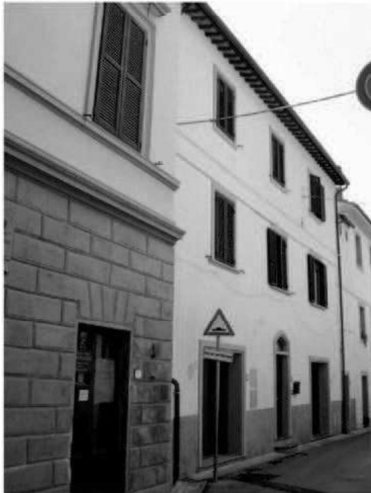
H2 via San Martino