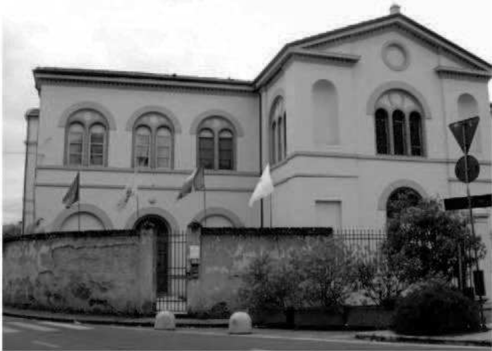
Q 11 - Via Battisti