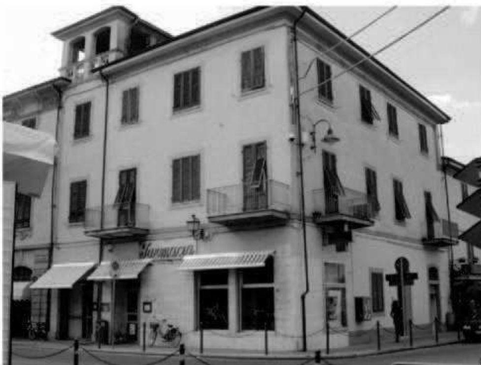
U 2 (piazza della Repubblica) via Roma