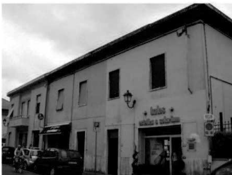
T1 via dei Mille