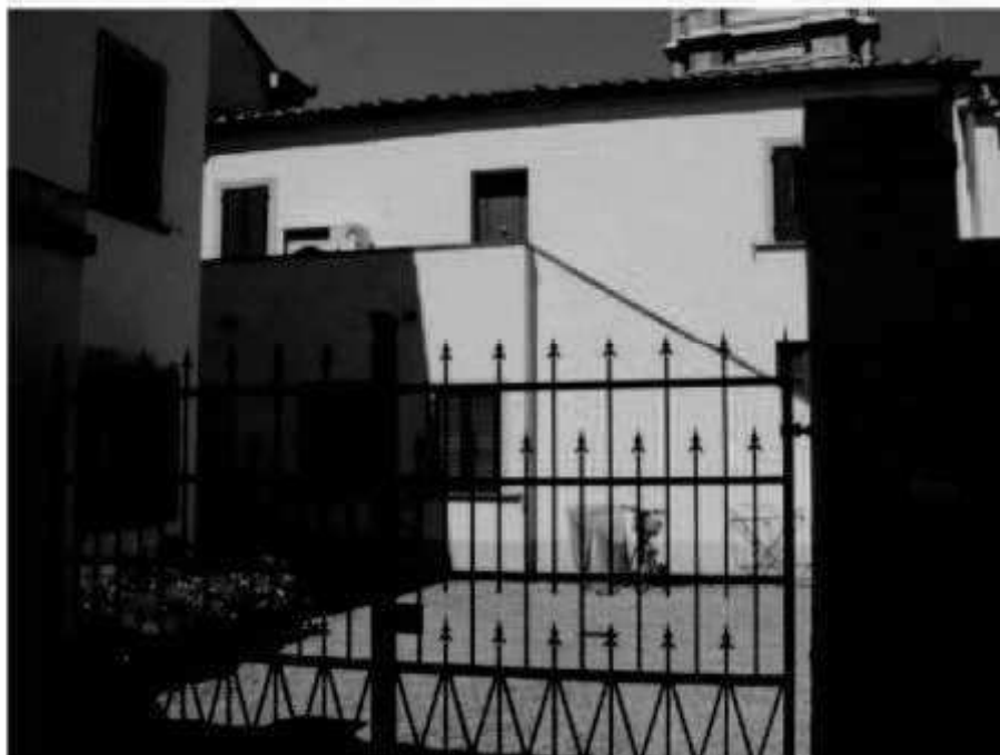
L 7b via dei Mille - via Magenta