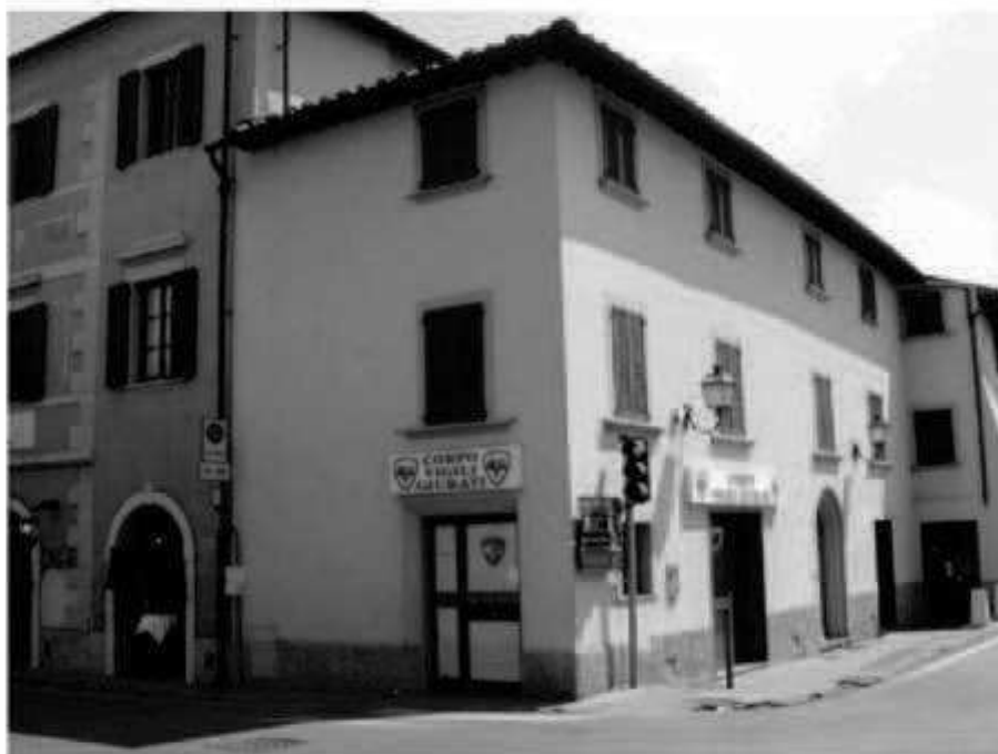
R 3 via Melegnano - via Marconi