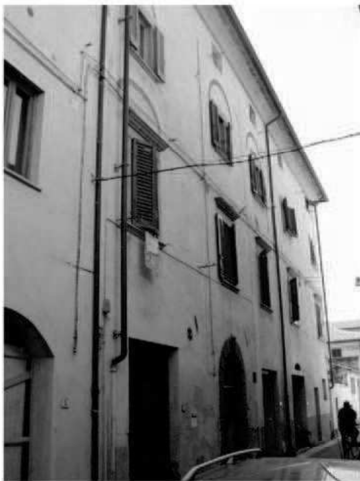
N 4 - via Garibaldi