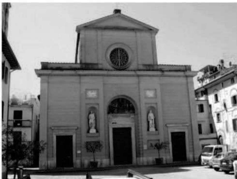
M 1 piazza San Giovanni