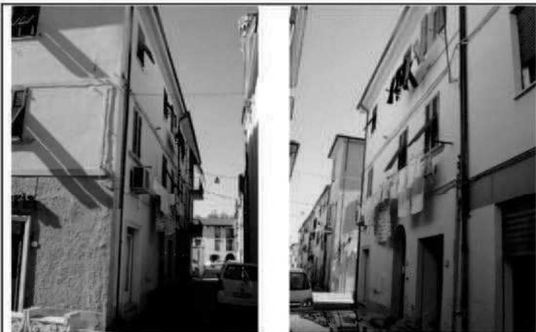
L.1 via Montebello