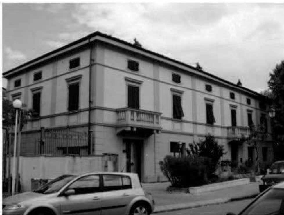
Z 2 via Carducci