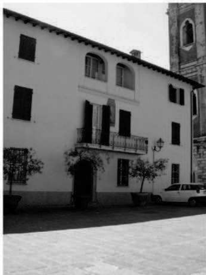
M 3 piazza San Giovanni -