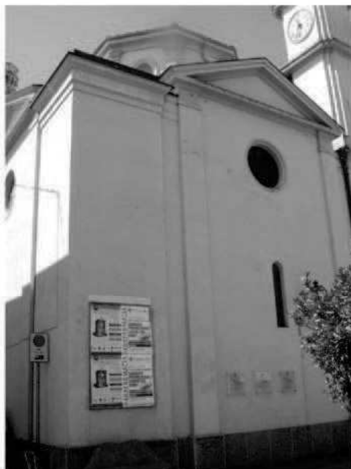
M 2 piazza San Giovanni