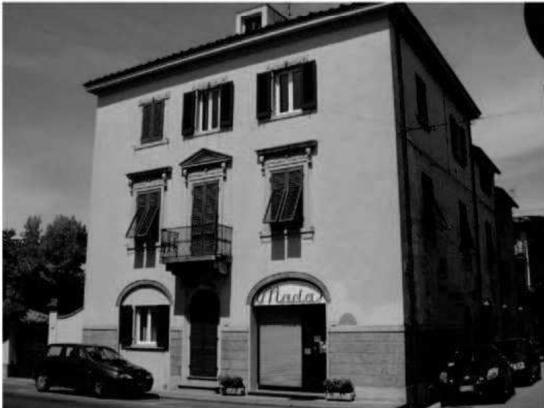
0 9 via dei Mille - via Garibaldi