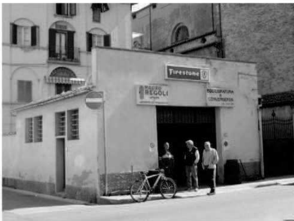
N 6 via dei Mille - via Garibaldi