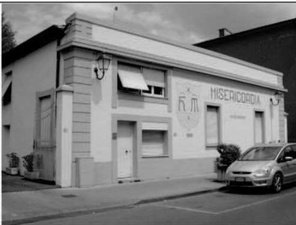
Z 3 via Carducci