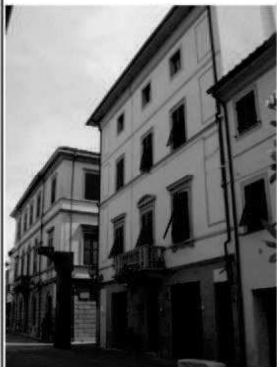
I 2 Corso Matteotti