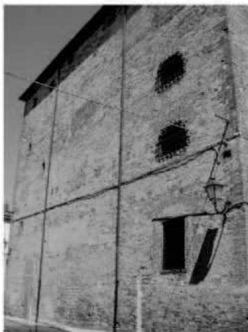
M1 via Dei Mille