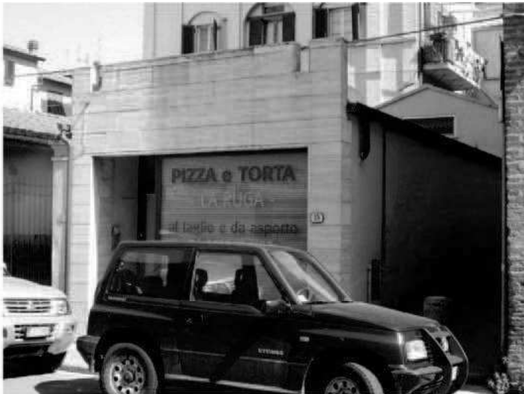
N 5 via dei Mille