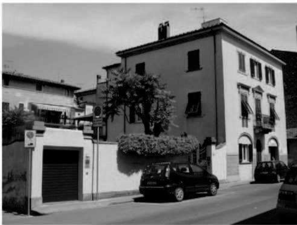
09 via dei Mille