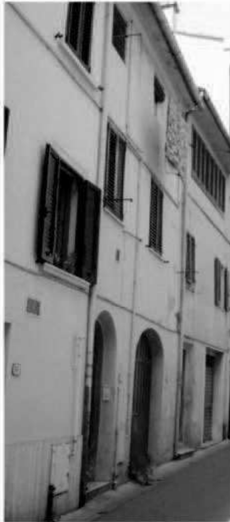
15 via San Martino