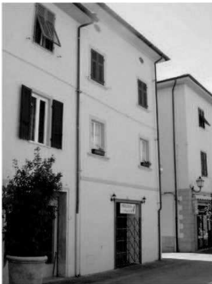
03 corso Matteotti