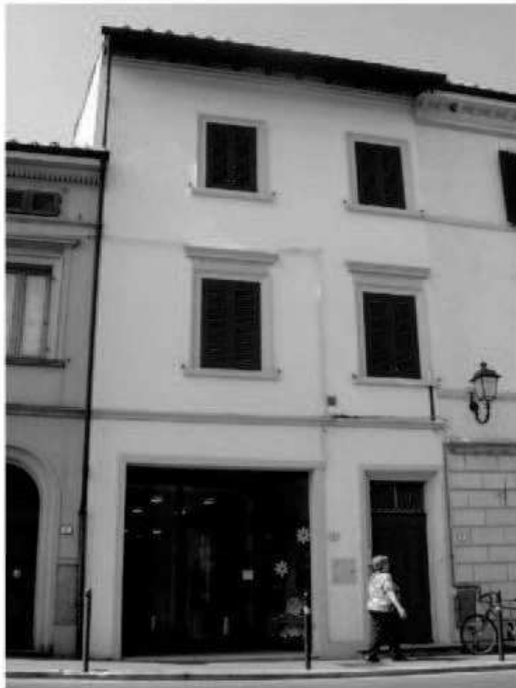
S 2 via Marconi