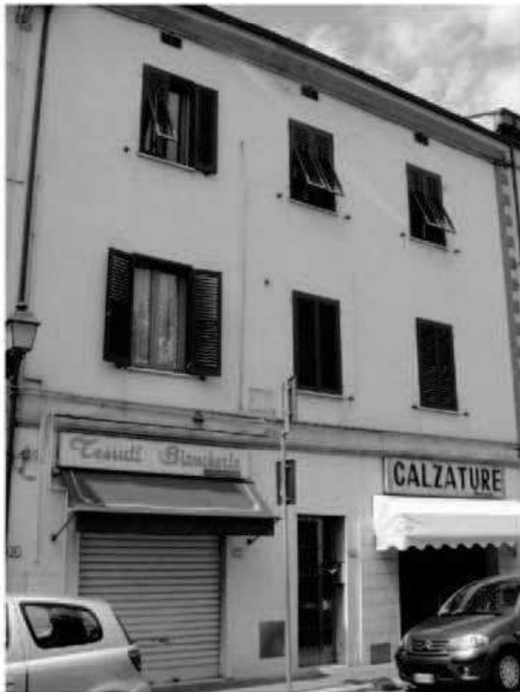
V.3 (piazza della Repubblica) via Roma