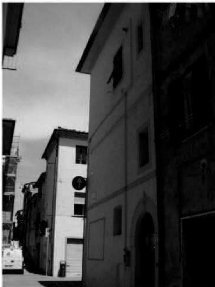
O 3 corso Matteotti - via Solferino