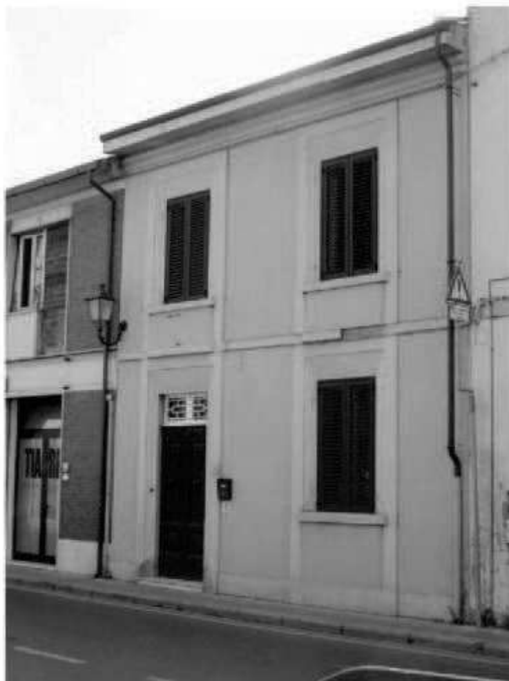
S 4 via Battisti