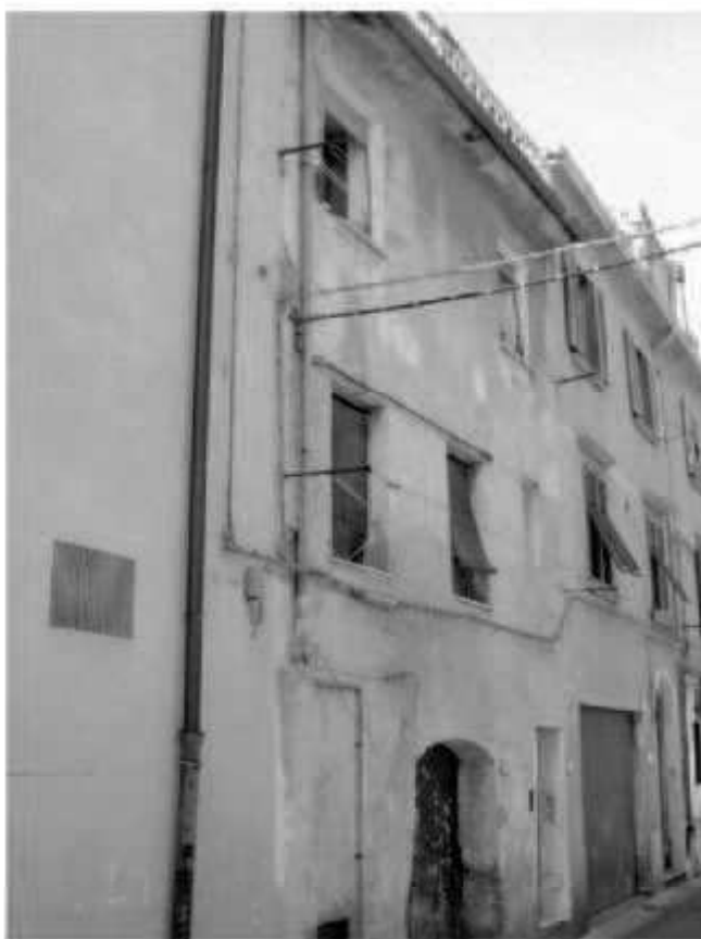
P 5 via Solferino