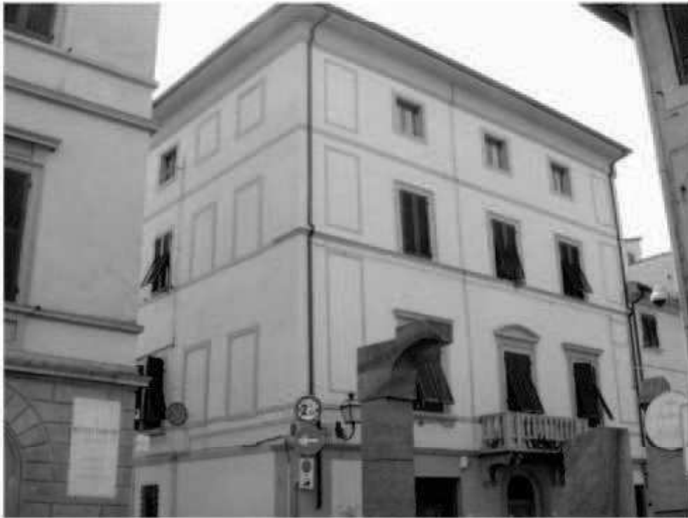
12 corso Matteotti - via San Martino