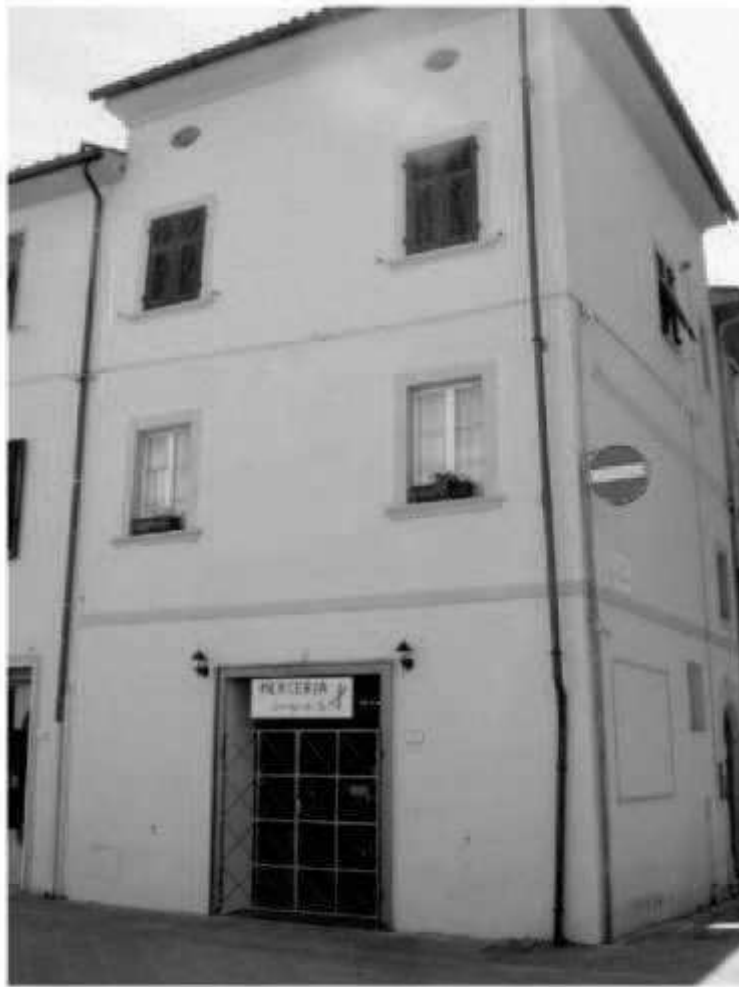
03 corso Matteotti