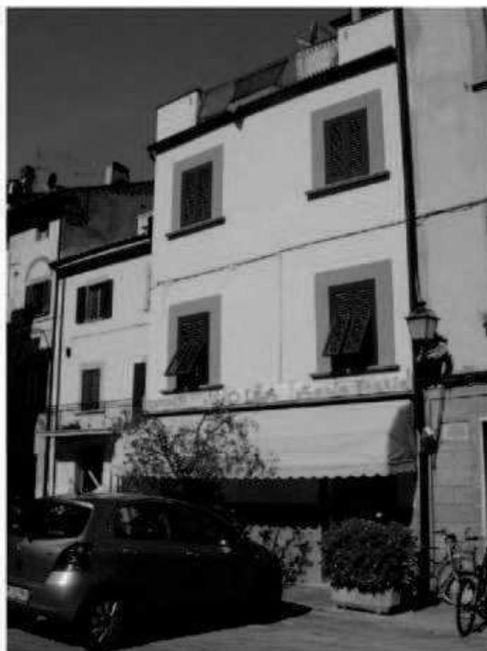
N 2 piazza San Giovanni