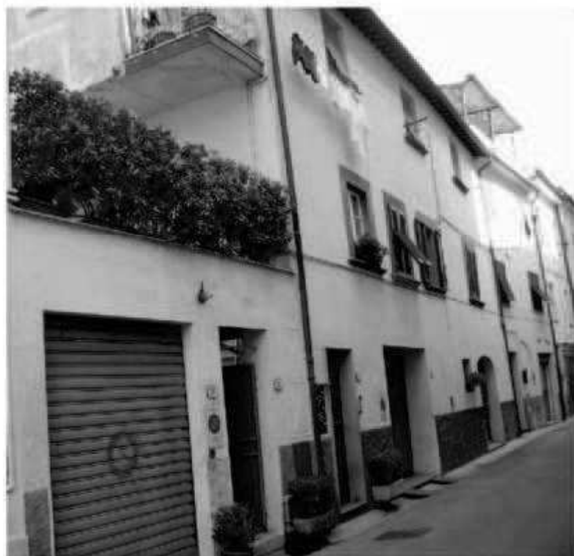
O8c via Garibaldi