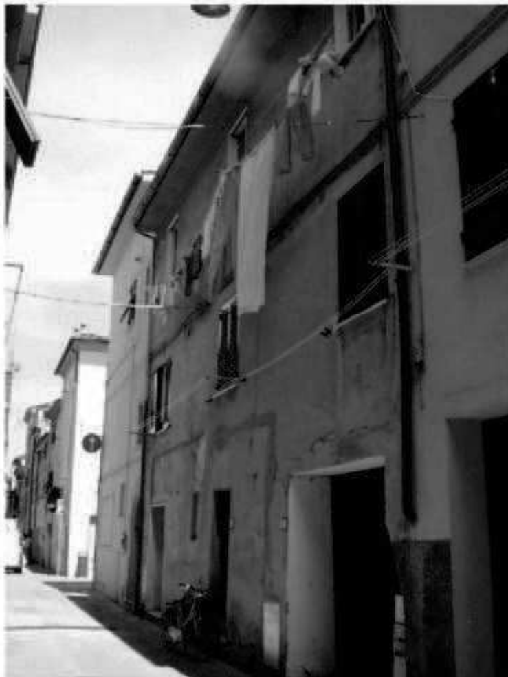
O3 Via Solferino n.3-3a-5