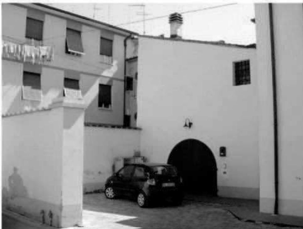
L 7 a- via Montebello