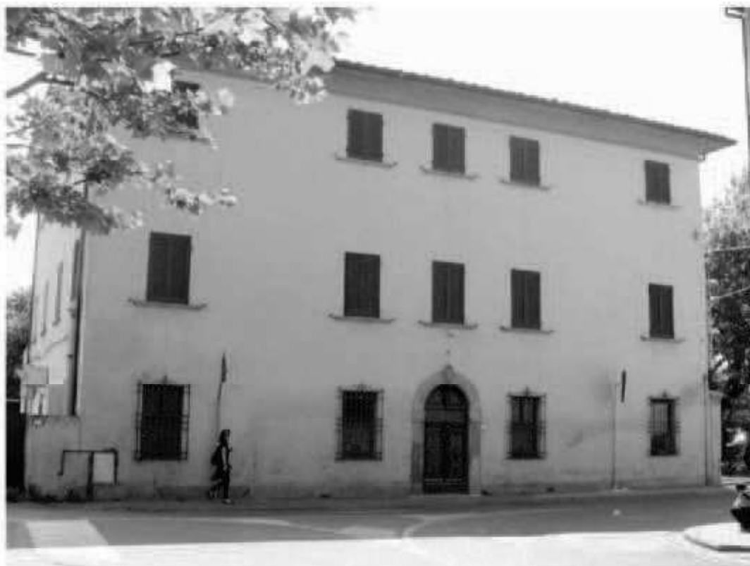
R 1 via Melegnano