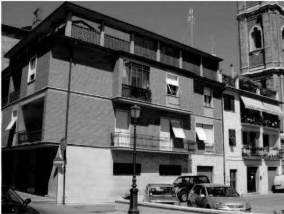
M4b via Montebello