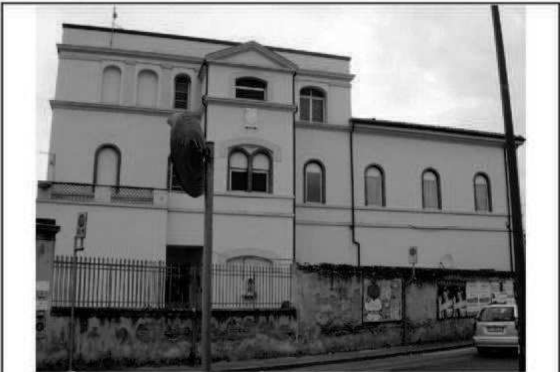
Q 11 Via Battieti