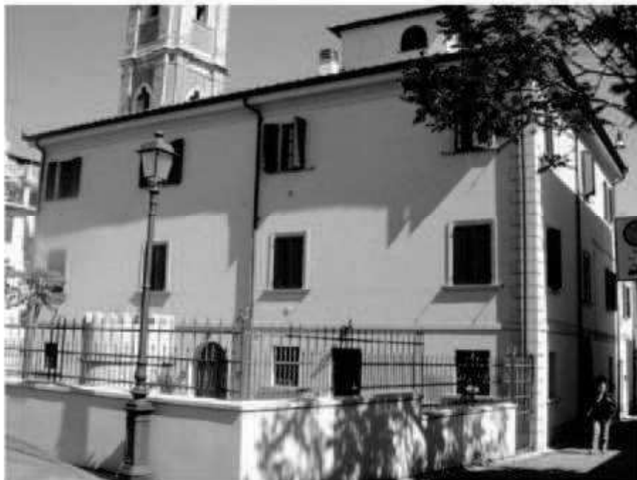
L 7c via dei Mille - via Magenta