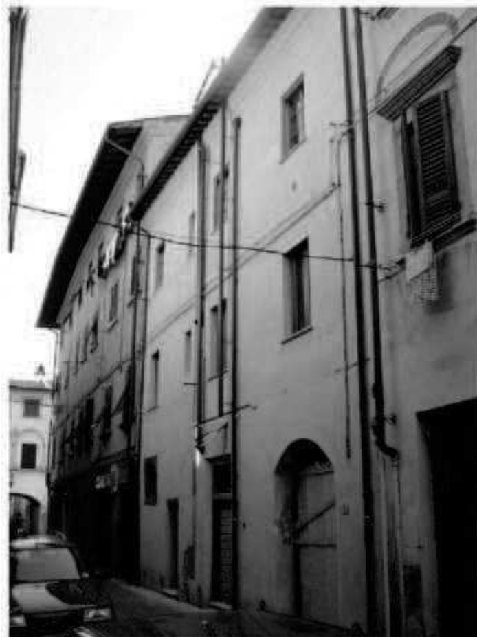
N 3 via Garibaldi