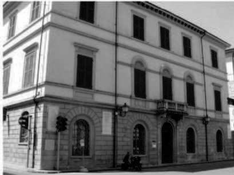
H 1 piazza Valli - via C. Battisti -