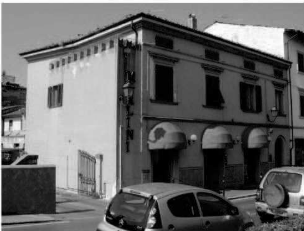
S 6 via Marconi