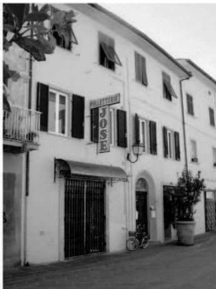
01 corso Matteotti