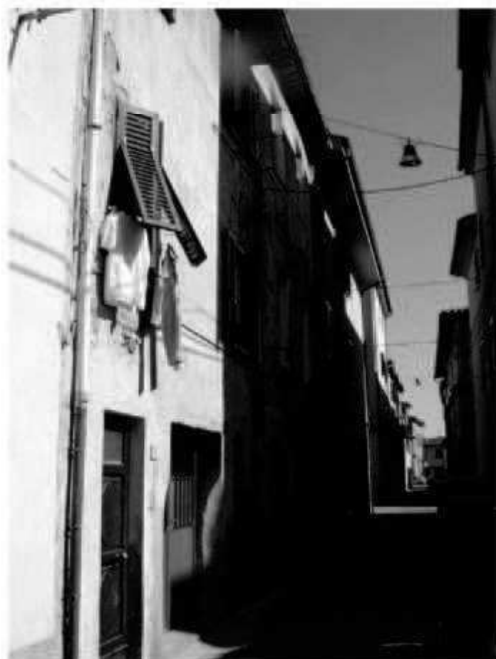
L5 via Magenta